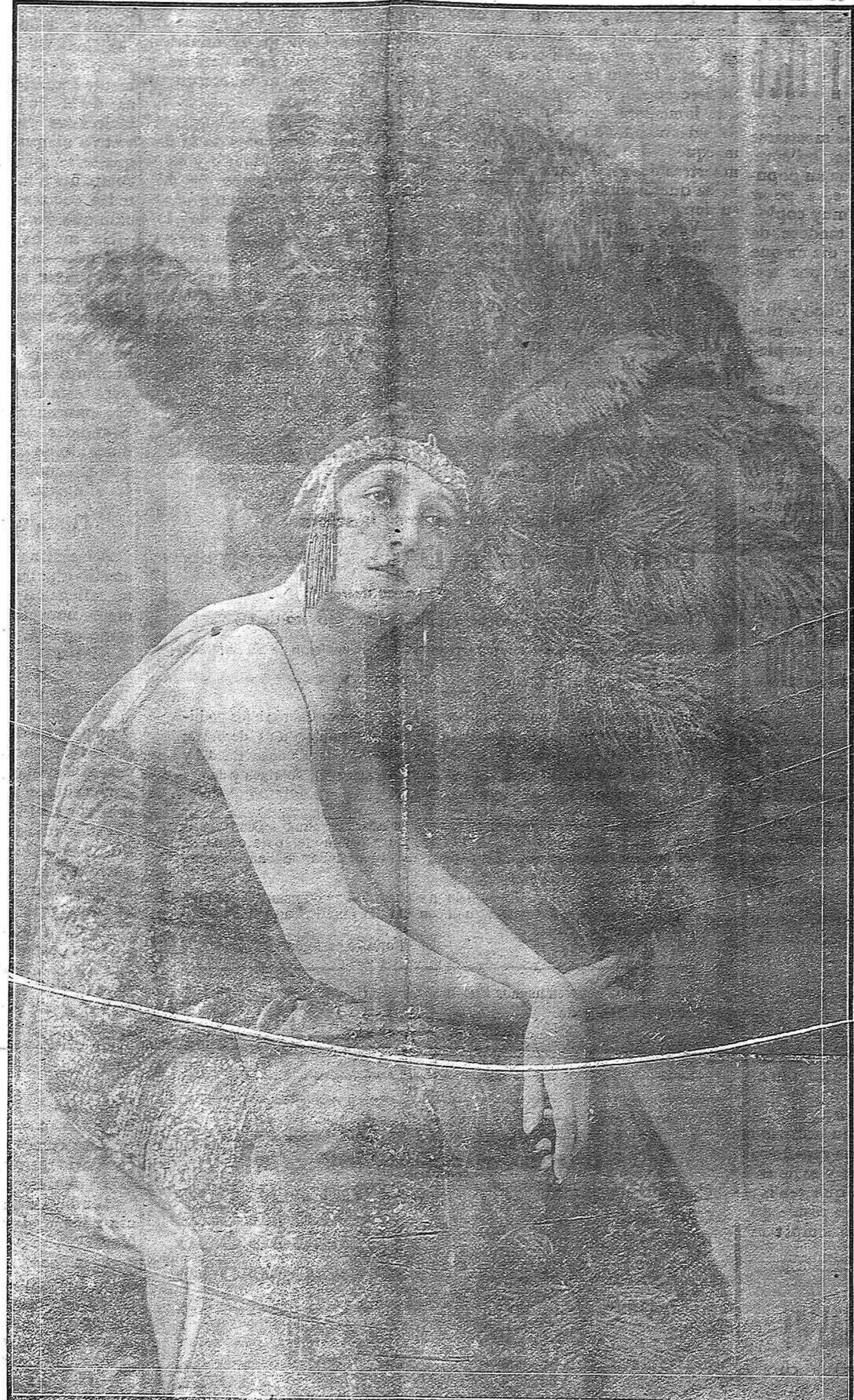
La bellísima y notable artista Eugenia Zuffoli, que actúa en el Nuevo Teatro