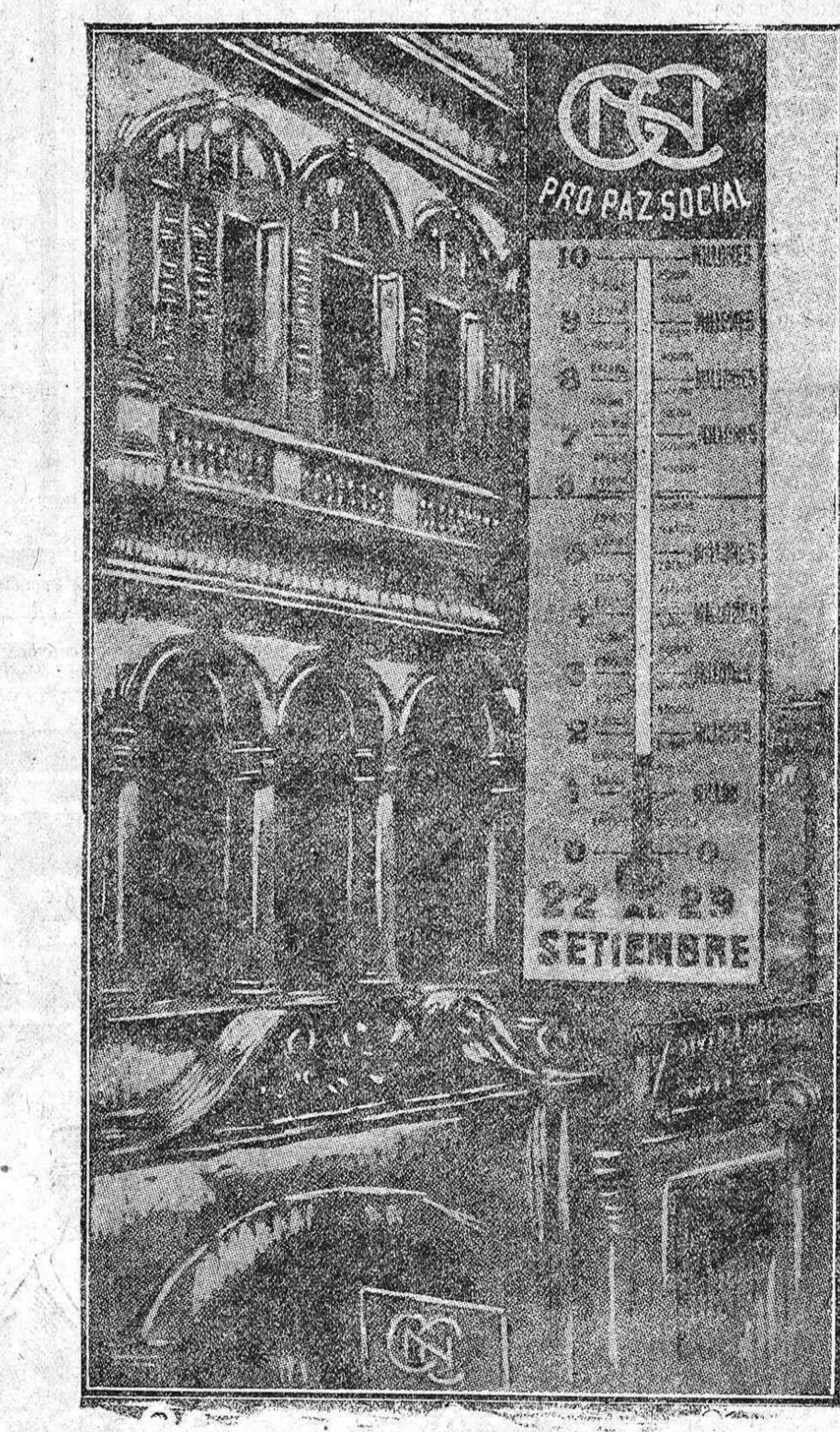
Se acordó también dar cuenta al público de los resultados por

Detalles de la organización Se constituyeron hasta 73 Comisiones, formadas cada una por tres personas, encargadas de visitar a los presuntos donantes, de los cuales se había establecido previamente un censo. Este comprende a las personas que se hallan en visible situación de poder contribuir a la colecta. Al frente de cada Comisión se designaba la persona que debía visitar al primer día, y que no se desentendiera durante toda la colecta, en el momento de la labor diaria y establecer el plan de acción para el día siguiente.