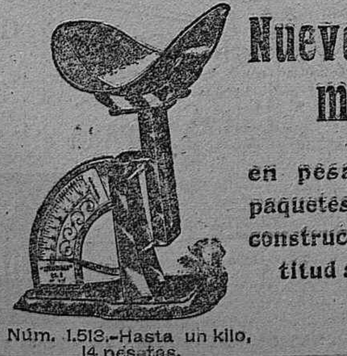
Núm. 1.513.-Hasta un kilo, 14 pesetas.

Si queréis un interruptor de porcelana barato y práctico, compradlo marca A. B. C. D. Grandes descuentos a los comerciantes. La Representación Americana. Alfonso XII, 24, Madrid.