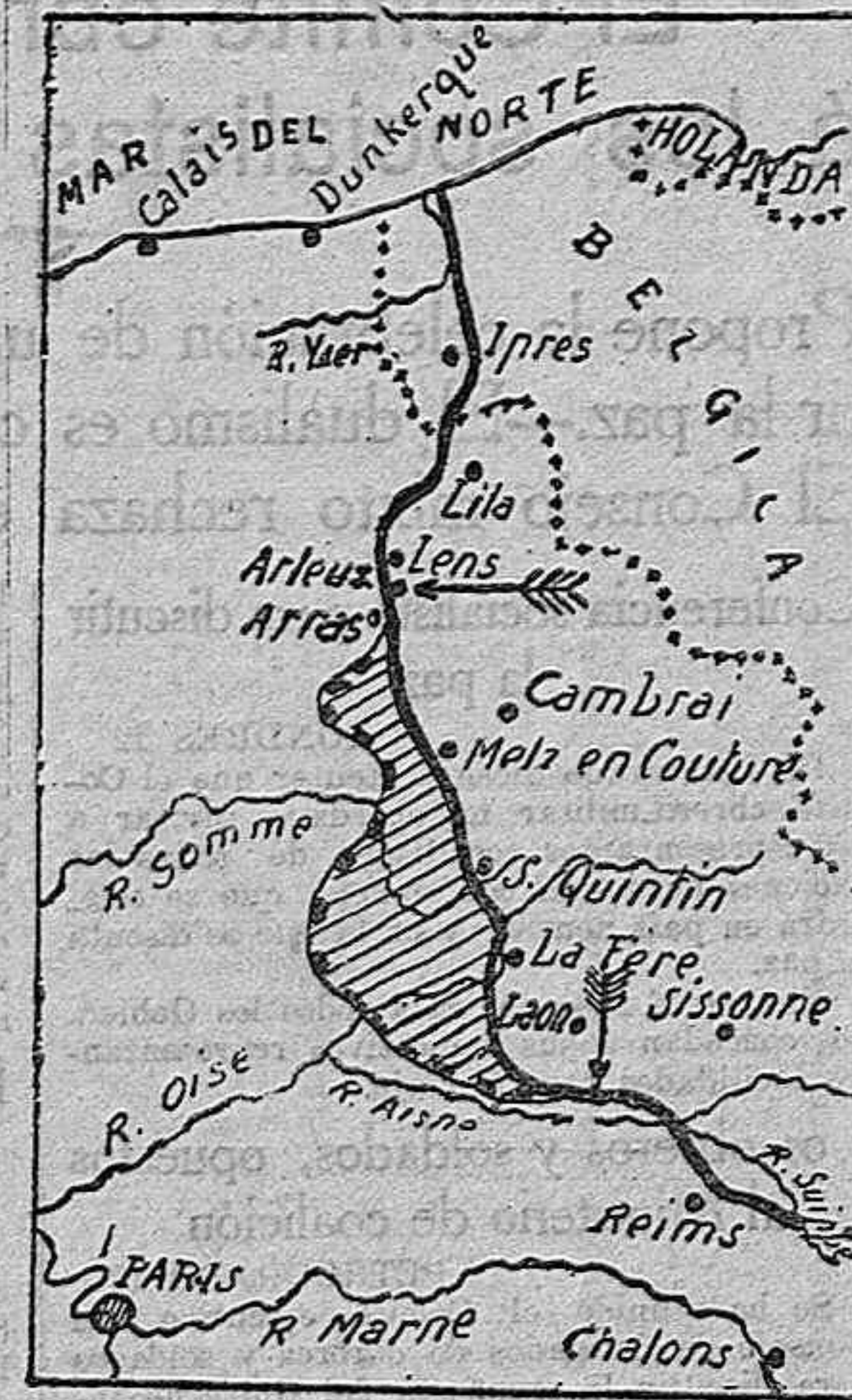
Escala. Kilómetros 0 50 100 Posición de los franco-ingleses en 15 de Marzo Posición actual