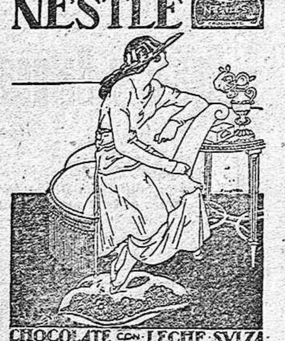
CHOCOLATE CON LECHE SVIZA El único que gustan las personas elegantes, y el que regala participaciones de la Lotería de Navidad.

El día 9 de los corrientes, a las doce de su mañana, se venderán en pública y extrajudicial subasta la Fábrica y terrenos adjuntos, sita en la calle de Castilla de esta ciudad, propiedad de los señores Jimenez y Compañía. La subasta tendrá lugar en la Oficina del Procurador y Corredor de Comercio don Pedro Usatorre, Cadena y Eleta n.º 12, en donde se halla de manifiesto el título de propiedad y condiciones.