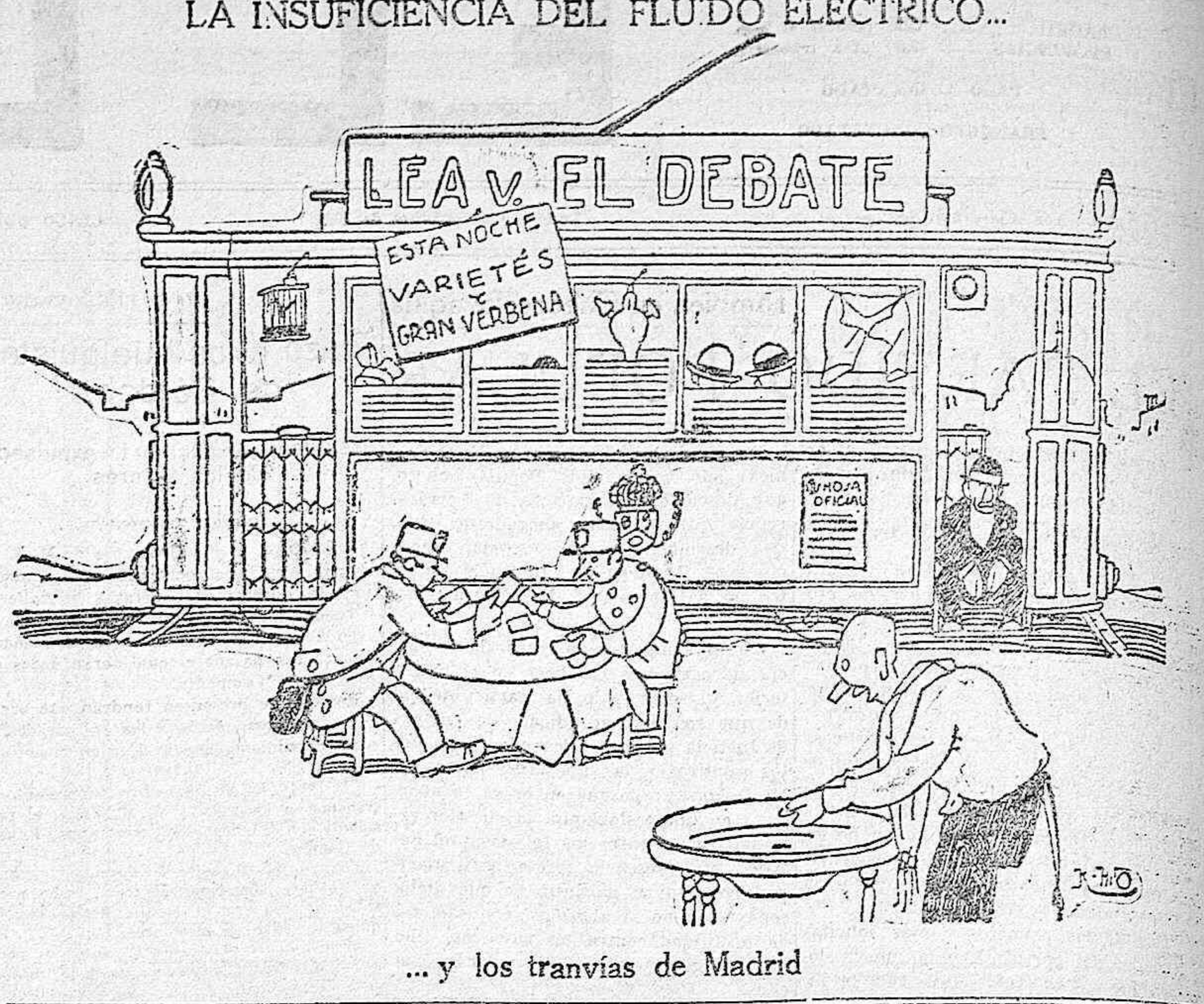
... y los tranvías de Madrid