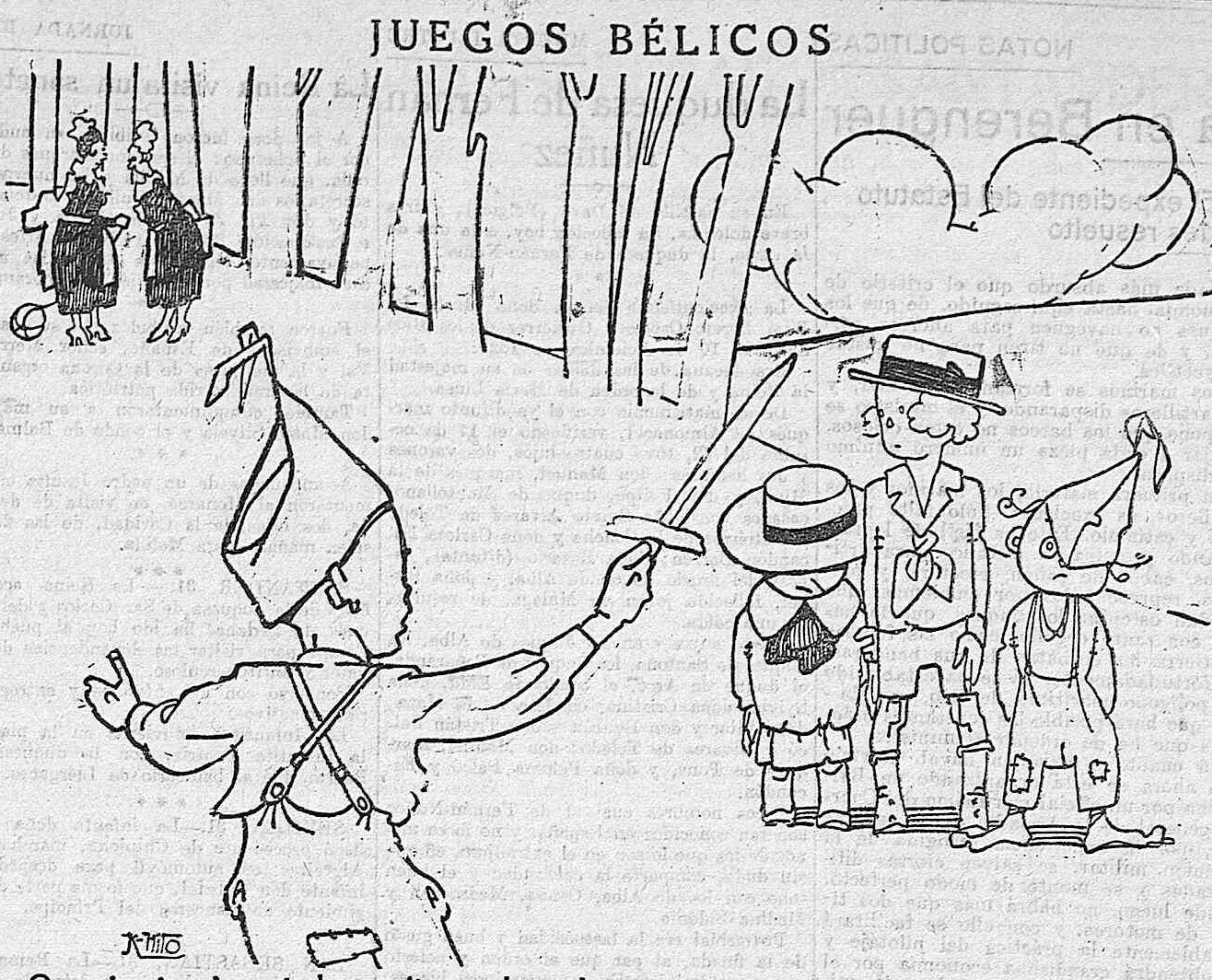
—Oye, si quiere jugar tu hermanito que haga de moro, porque siempre lo "escalabramos."