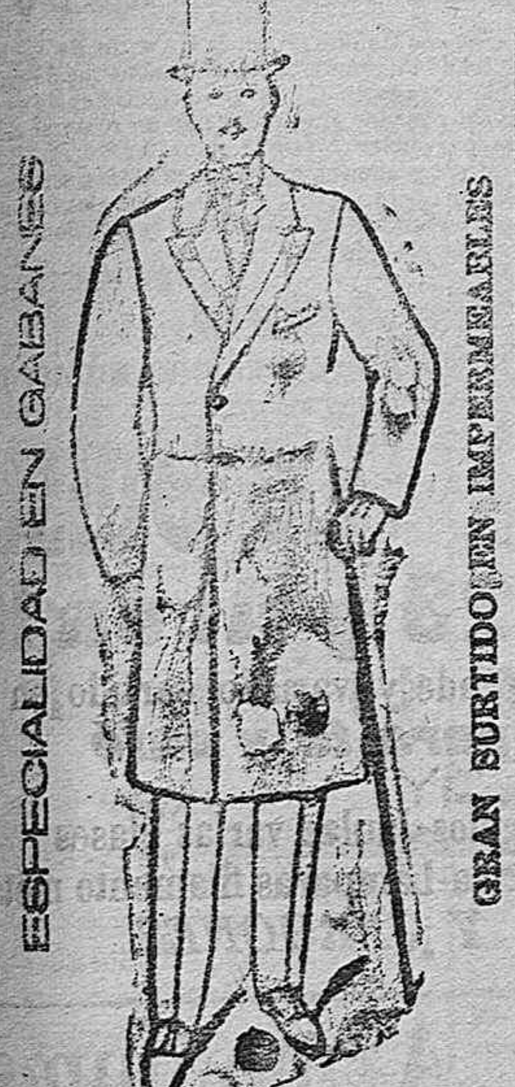
Especialidad en gabanes

Vacos lecheras pura raza Suiza. Se venden. Informar en las oficinas del Sindicato Agrícola Alavés-Oriente 15-Vitoria. 485