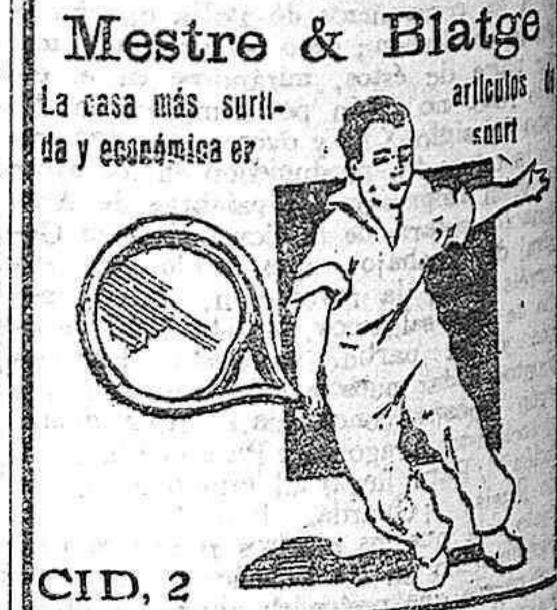
Mestre & Blatge La casa más surtida y económica de artículos de...

Se acordó comunicar la protesta al presidente de la Audiencia, y anunciarle que en tanto no se concreten cargos, se determinen responsabilidades o se den satisfacciones, no acudirán los diputados a dicho tribunal provincial.