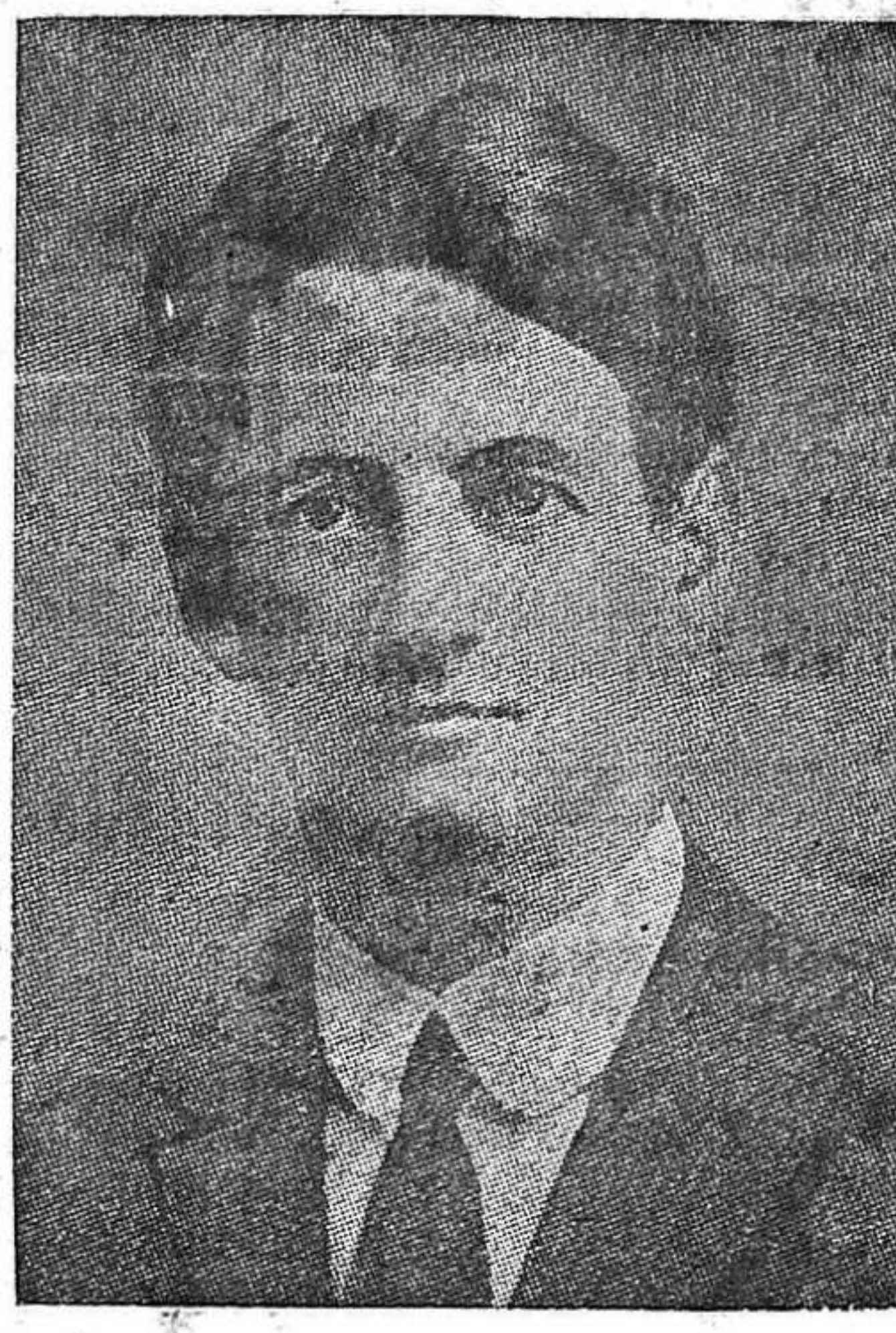
Mr. Mac Swiney, alcalde de Cork fallecido recientemente.