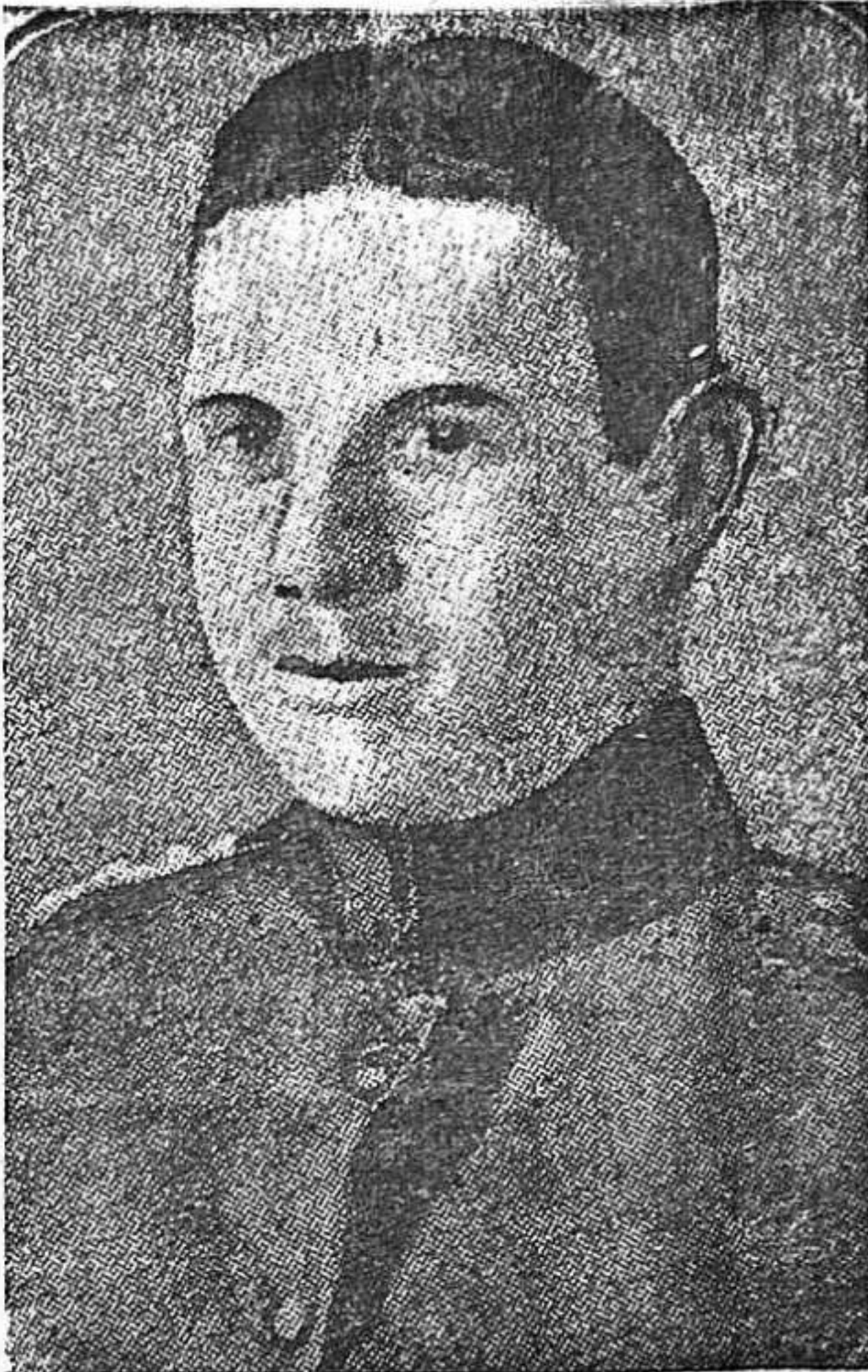
El rey Alejandro de Grecia, fallecido recientemente

Se alquilan aos, con sus alcobas, en casa particular. Toda asistencia. Razon en esta Administración.