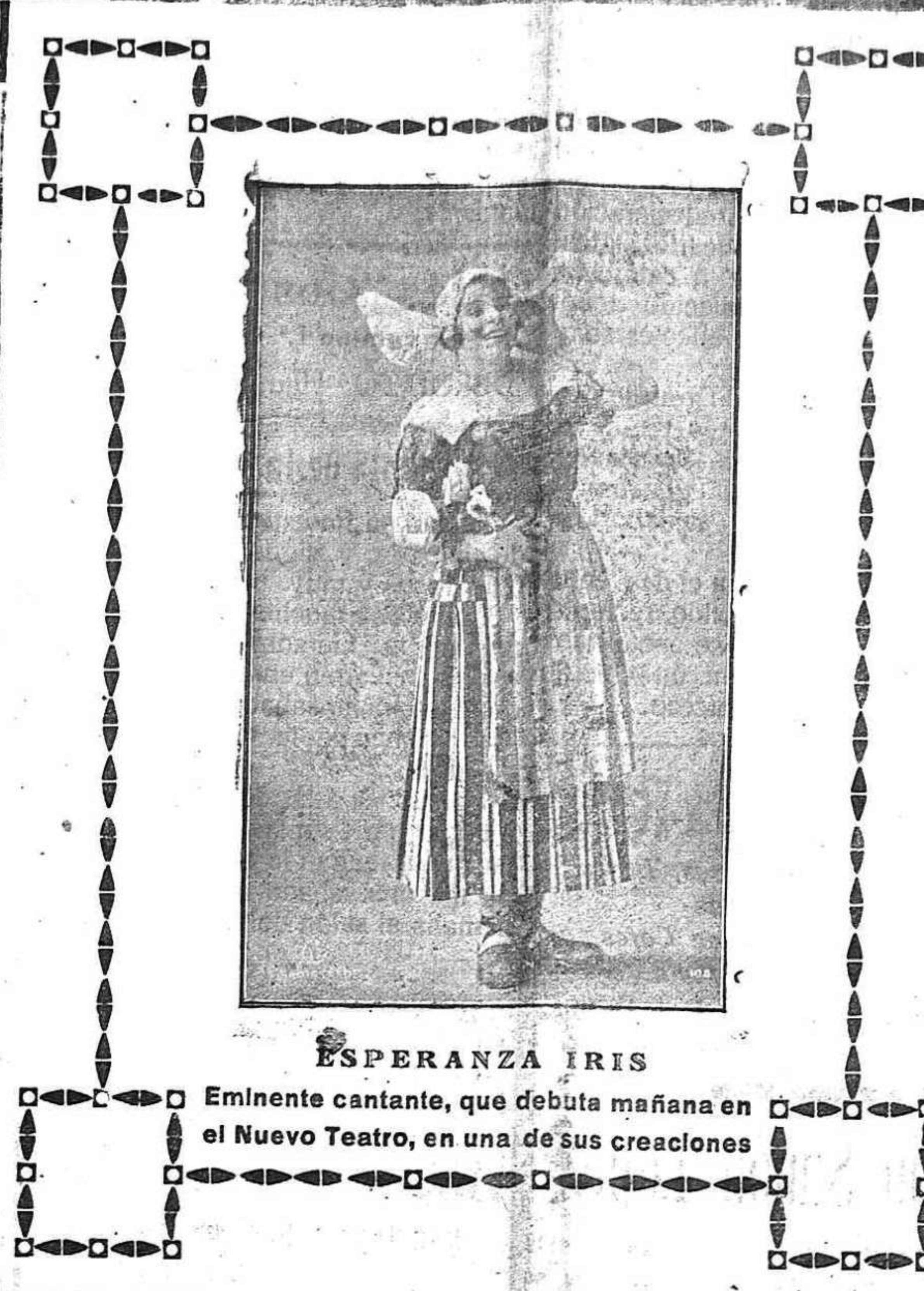
ESPERANZA IRIS Eminente cantante, que debuta mañana en el Nuevo Teatro, en una de sus creaciones