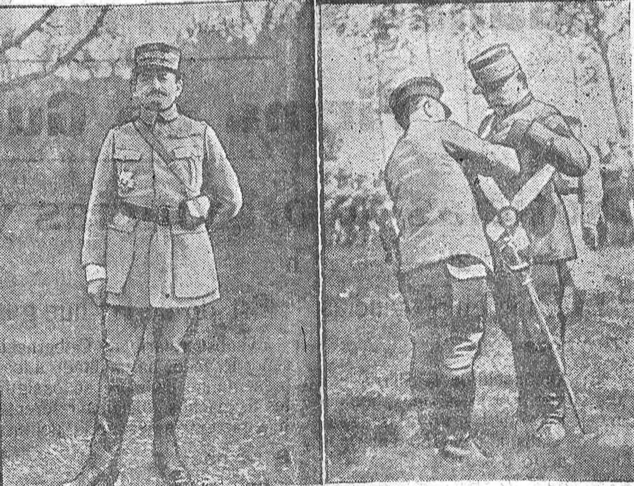
El general Mangin El coronel japonés Nagl, entregando al general francés Roques la cruz de la Orden del Sol Naciente