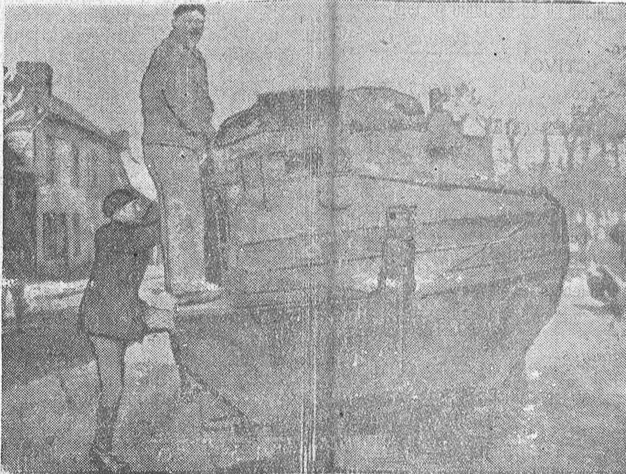
Un "famke", haciendo pequeñas reparaciones