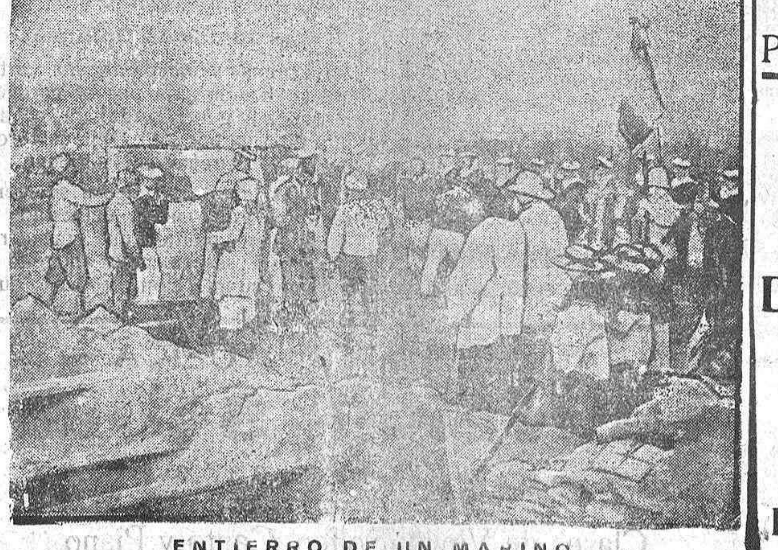
ENTIERRO DE UN MARINO