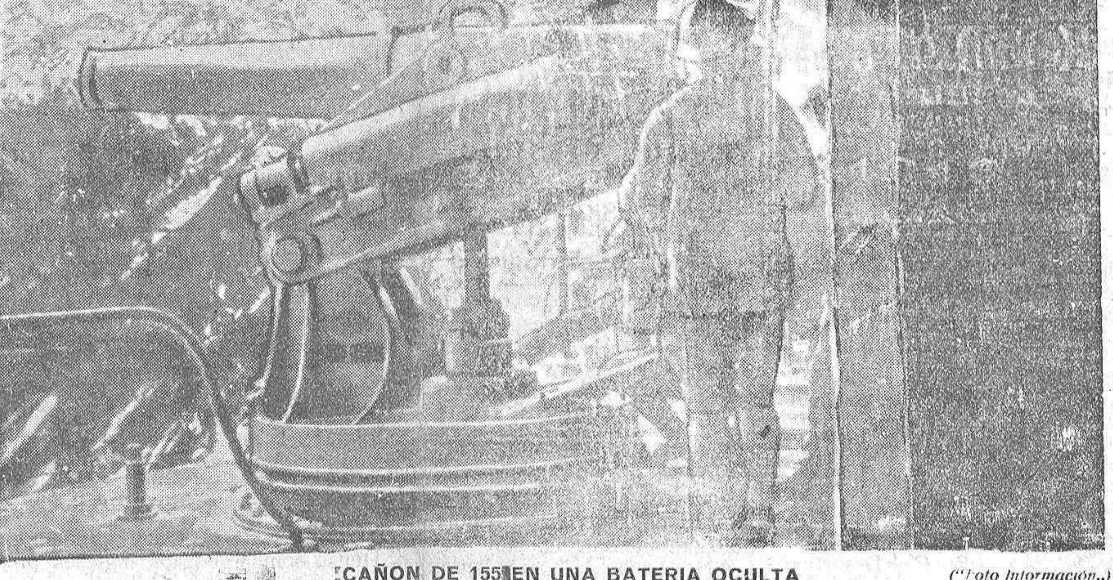
CAÑÓN DE 155 EN UNA BATERIA OCULTA

Colegio Médico. También serán castigados con las anteriores censuras las faltas de moral médica que denuncie la Junta de Gobierno del Colegio Médico alavés, que podrá imponer las dos primeras, reservando á S. E., con audiencia del Partido, las dos últimas.