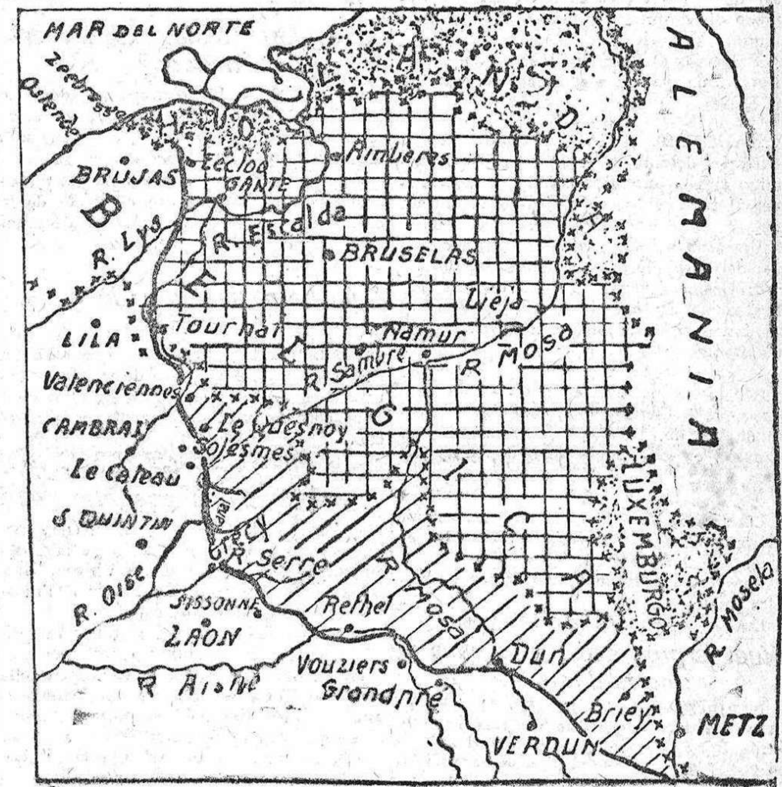
Escala Kilómetros 0 10 20 30 40 50 60 70 80 90 100. Posicion actual de la linea de batalla. Fronteras. Territorio belga en poder de los alemanes. La frances en id. de los id. Naciones neutrales.