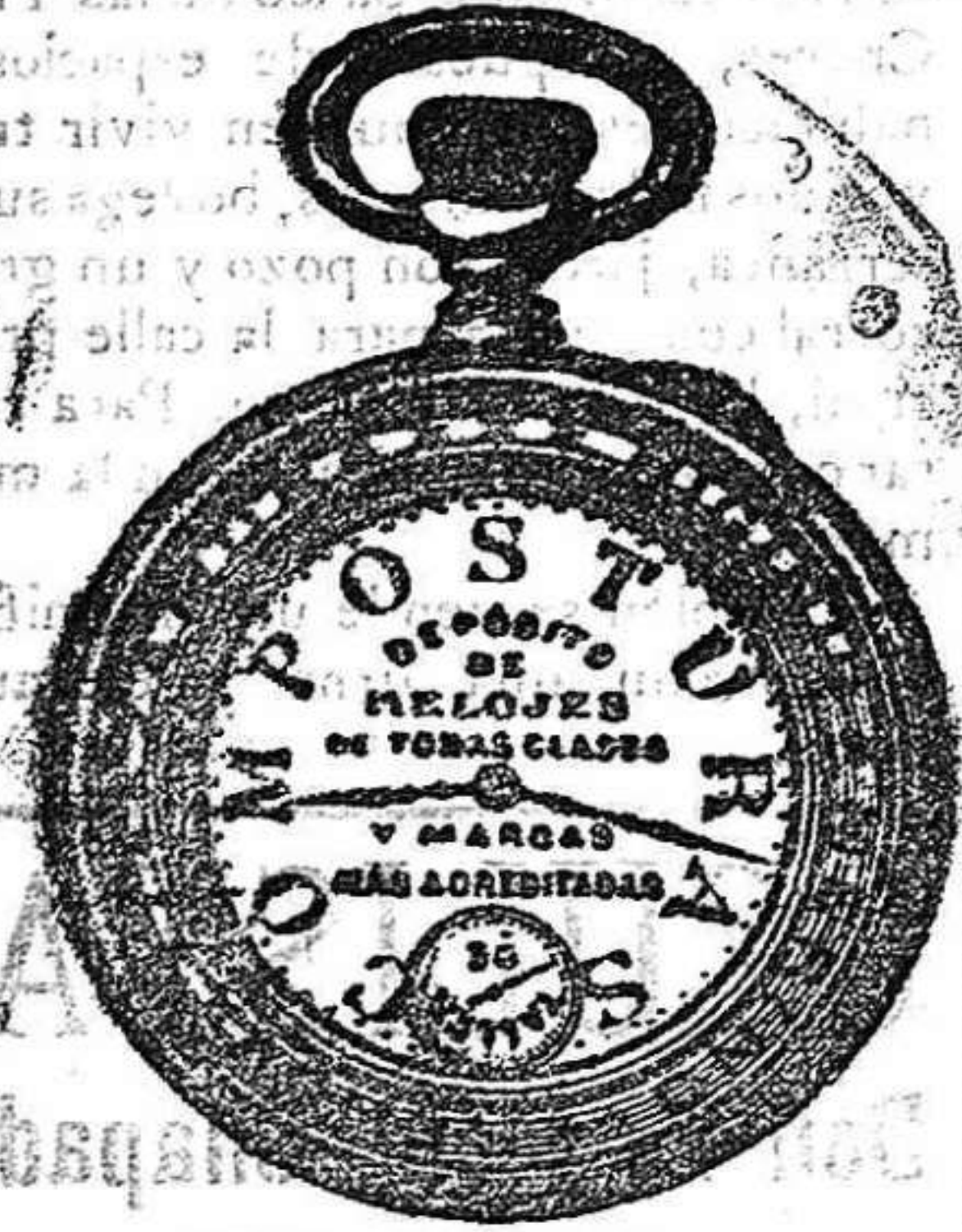
Relojes sistema Reskopf á 12 pesetas.