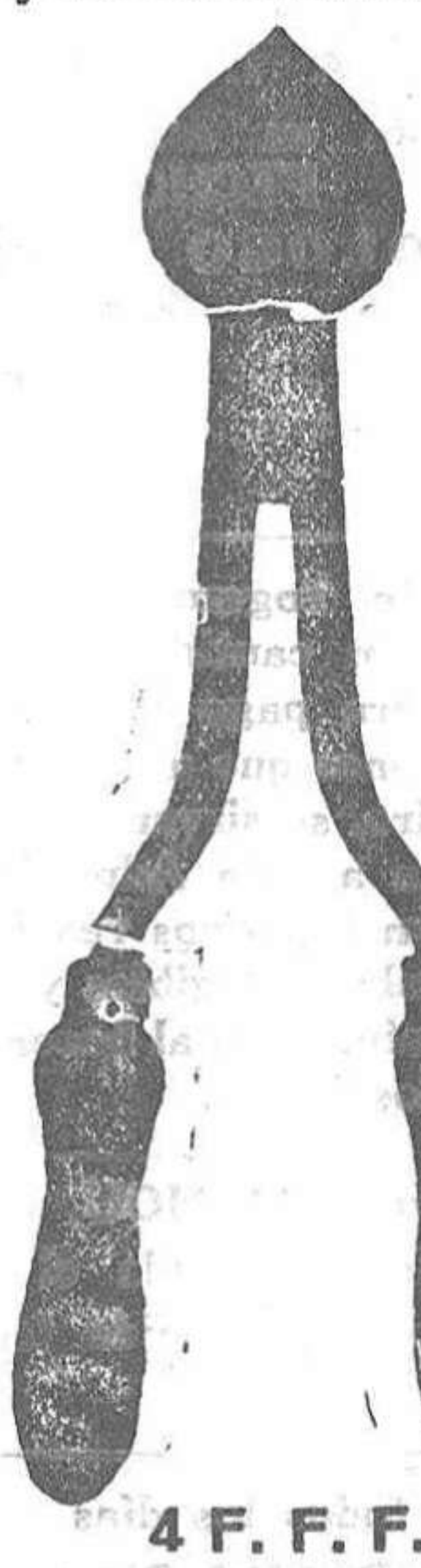
4 F. F. F.

Para los consumidores de TIJERAS DE PODAR tiene esta casa los dos modelos para la presente temporada, los que se distinguen por su calidad y ser extraordinariamente fuertes.