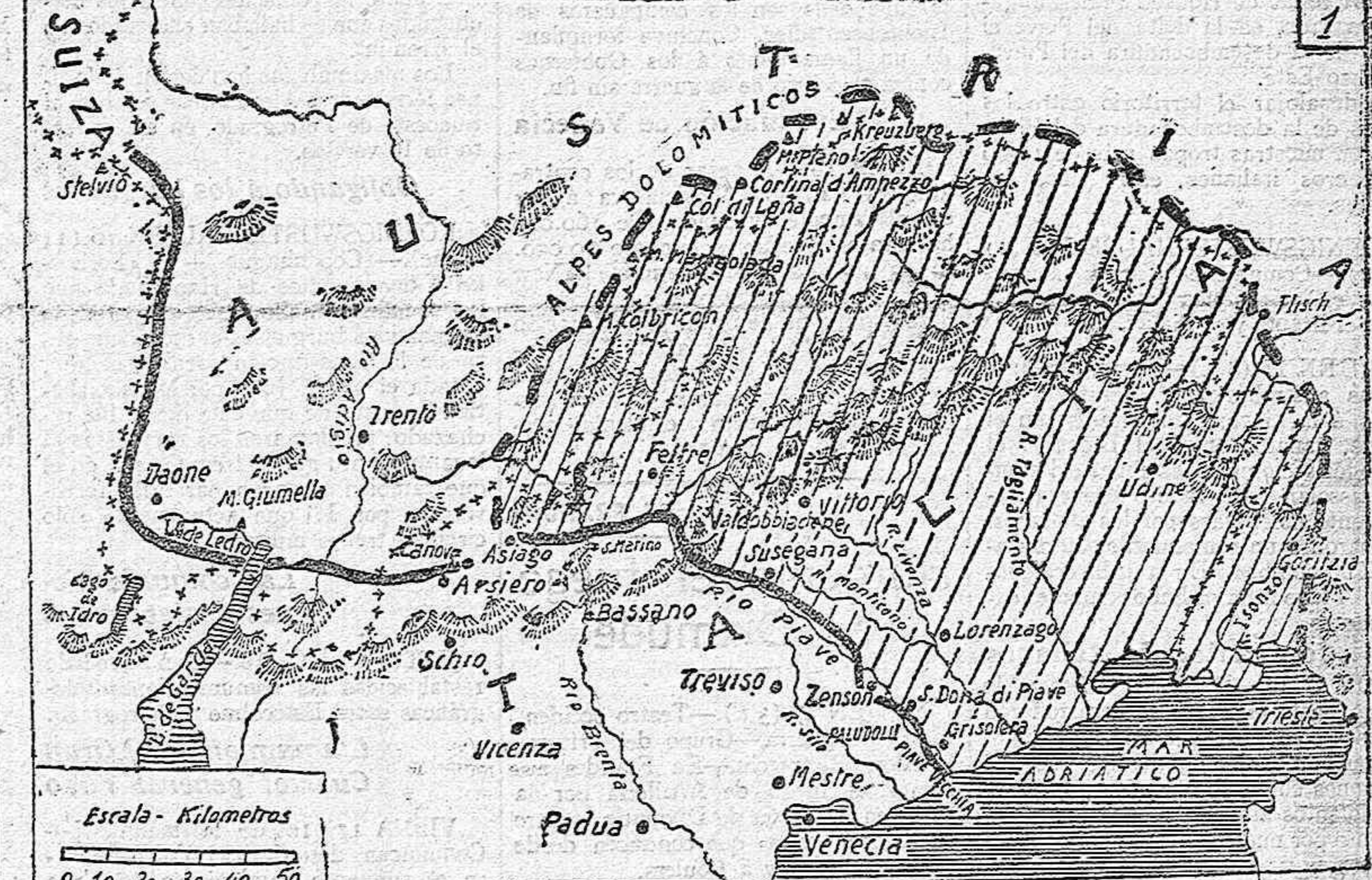
Posicion que ocupaban los austro-alemanes el 25 de Octubre último. Posicion actual. Limite de la Zona montañosa. Zona conquistada por los austro-alemanes.

italiano... Y como una de mis manías es la de buscar puntos por los mapas, cabizbajo, al ver cuán grande fue mi error al creer en el triunfo de los Imperios centrales, busco S. Marino, donde los italianos han rechazado á sus enemigos (croquis 1 y 2); Cison, que cuentan los alemanes que han tomado (¡buenas conquistas te dé Dios!), y el monte Prassolan, donde los italianos contratacaron; y cuando hallo esos puntos me encuentro con la sorpresa del que metiera una placa fotográfica en el líquido revelador y al mirarla al tráfuz se encontrara con un gallo creyendo hallar una liebre. Y torno á pensar si estaré loco, pues es difícil entender estando en su sano juicio cómo los austroalemanes, que no ha-