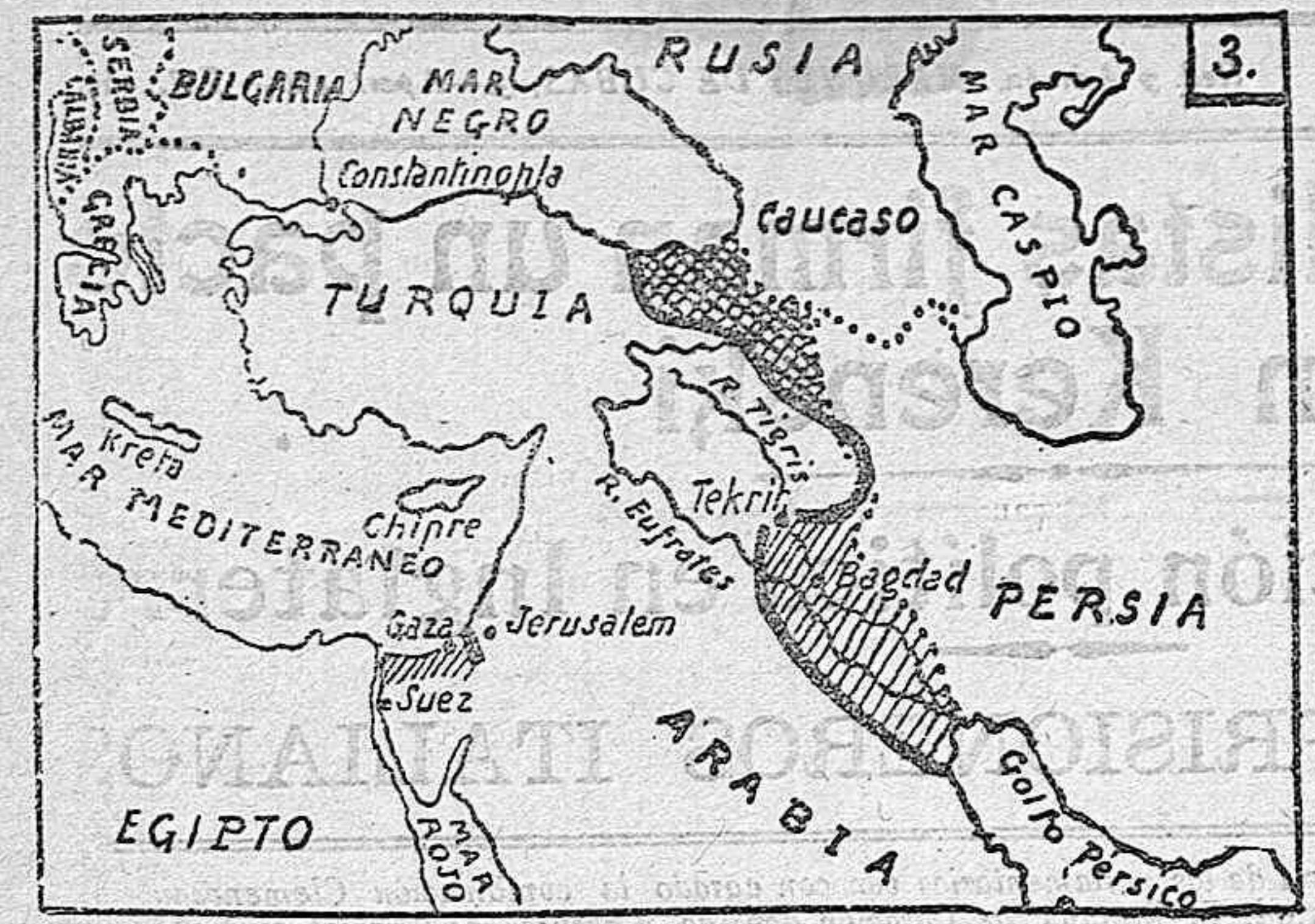
Zona conquistada por los rusos. Zonas conquistadas por los ingleses.