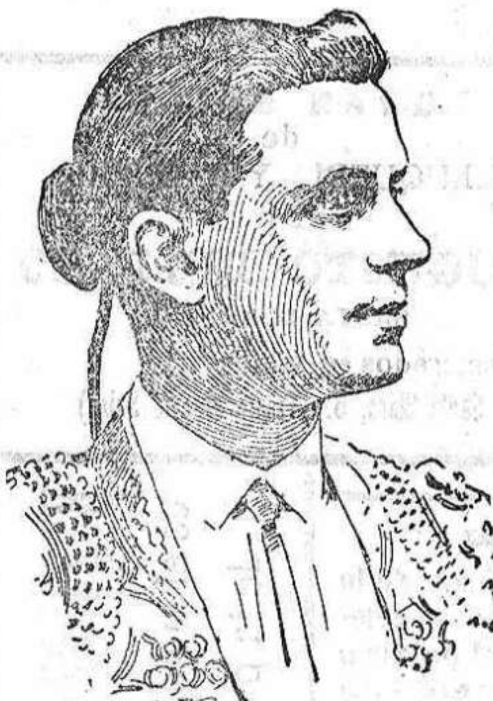
Rafael González Machaquito.