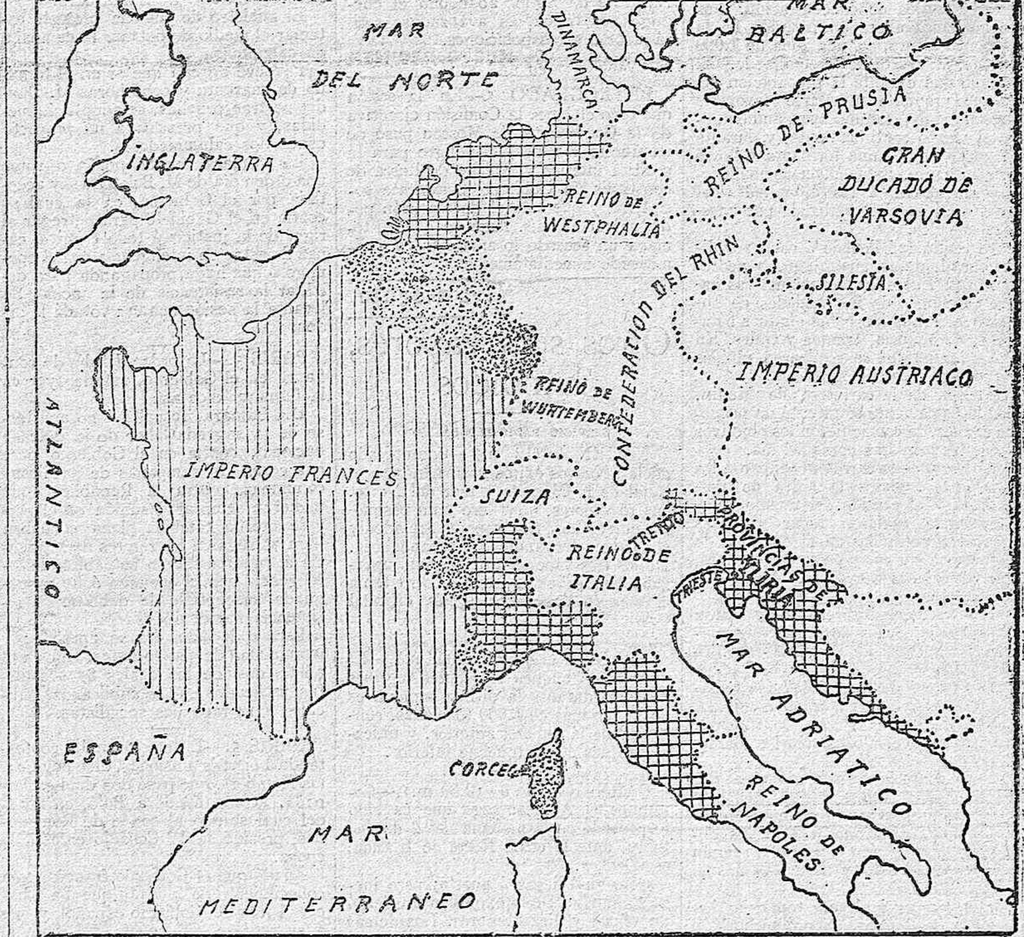
Francia en 1789. Francia despues del tratado de Luheville (1801) Extension del Imperio francés en 1812.

En cuarta plana: DEPORTES Regatas y carreras en San Sebastián