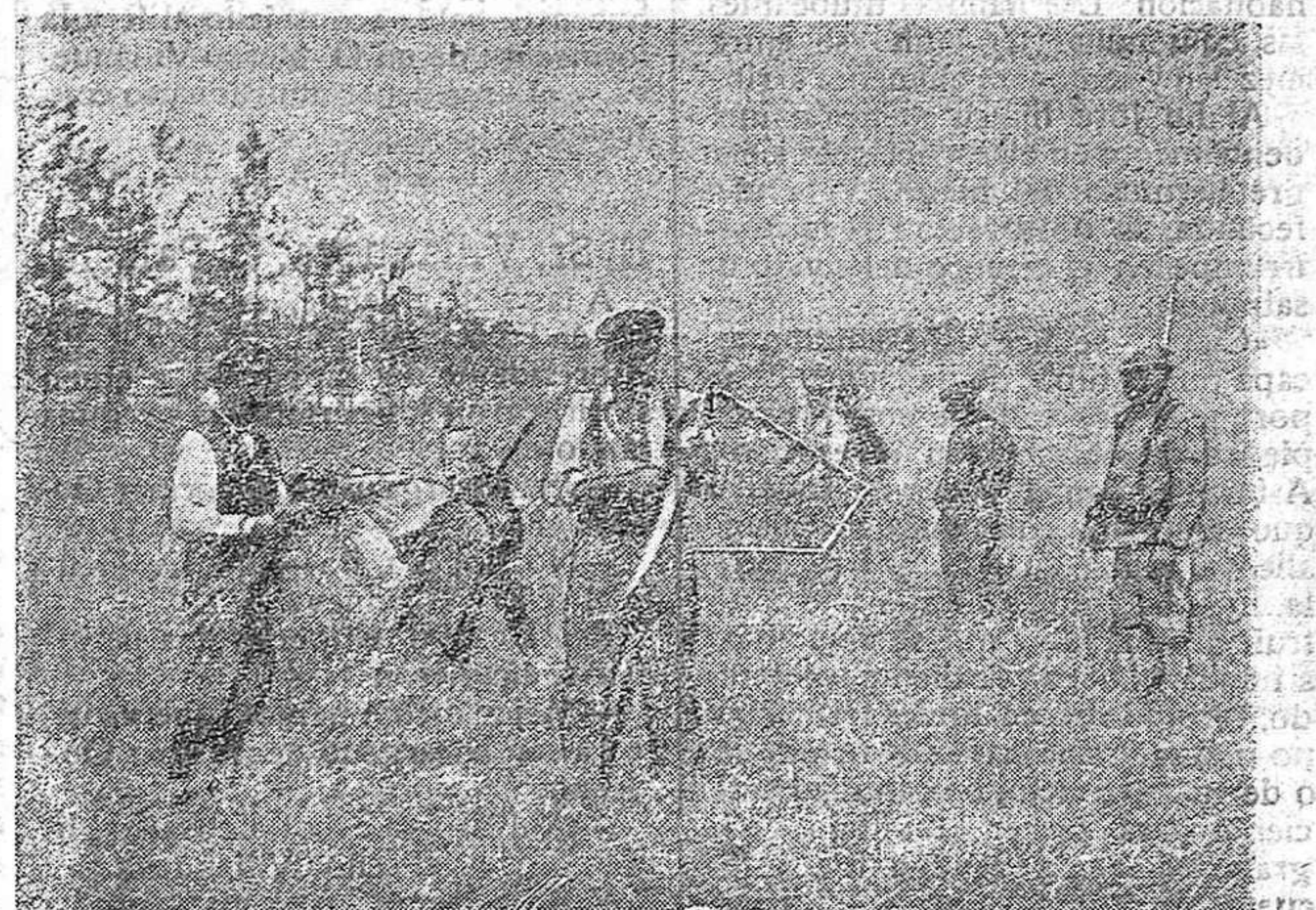
DE LA GUERRA.—Prisioneros alemanes haciendo la recolección en terreno conquistado.

Yo esperaba que el Congreso de los diputados sirviera de eco a la indignación muda de las víctimas. Se reunió el conclave de la Patria. El primer día de sesiones concluyó. Aún esperé. ¿Será más tarde...? Y han pasado varias sesiones sin que surja la palabra. ¿Dónde están los representantes del país famélico? ¿Dónde los amantes de la justicia? Oyendo muchos discursos he adivinado que los que los pronunciaban eran ciertamente diputados de un país... ¿Pero lo eran de España...? Eso de ninguna manera. Una inverosímil forma del exotismo se ha introducido en la tribuna de los Argüelles, de los Olózaga, de los Castelar y de los Canalejas... No se escuchan allí las voces de la Patria; antes bien, se oyen las de los enemigos de España. Y es más odiosa que la audacia de los dicentes, la cobardía o la incompreensión de los resignados auditores... Pero advertiréis que del tétrico problema del hambre, de la odiosa codicia de los mercaderes,