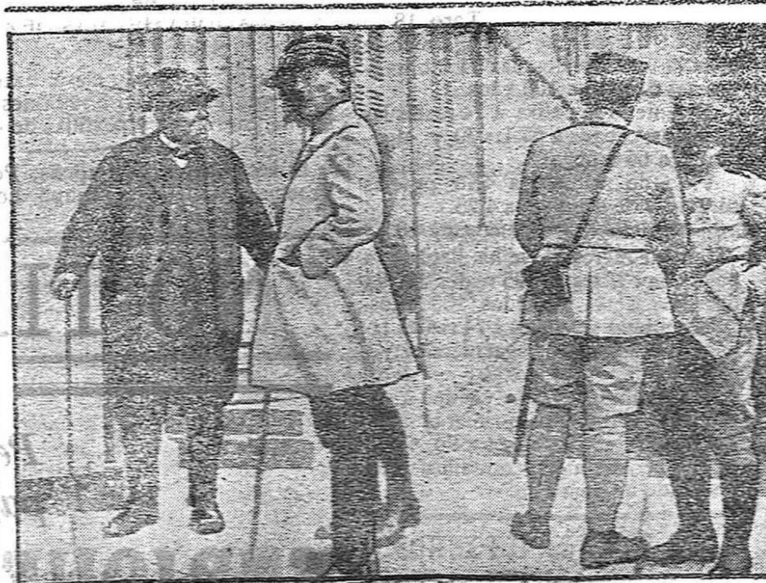
DE LA GUERRA.—M. Clemenceau, visita la región del Aisne.

¿No habéis presenciado nunca el espectáculo nocturno de la Ciudad Lineal? Pues parece de cuento de hadas. Porque en los cinco o seis kilómetros que ha de recorrer el tranvía véis como en la mañana, en lo más alto del montículo, brillan como locas millares de lucecillas. Es la iluminación de la famosa voladora que hay en el Parque de recreo. Hombres y mujeres ocupan las barquillas que