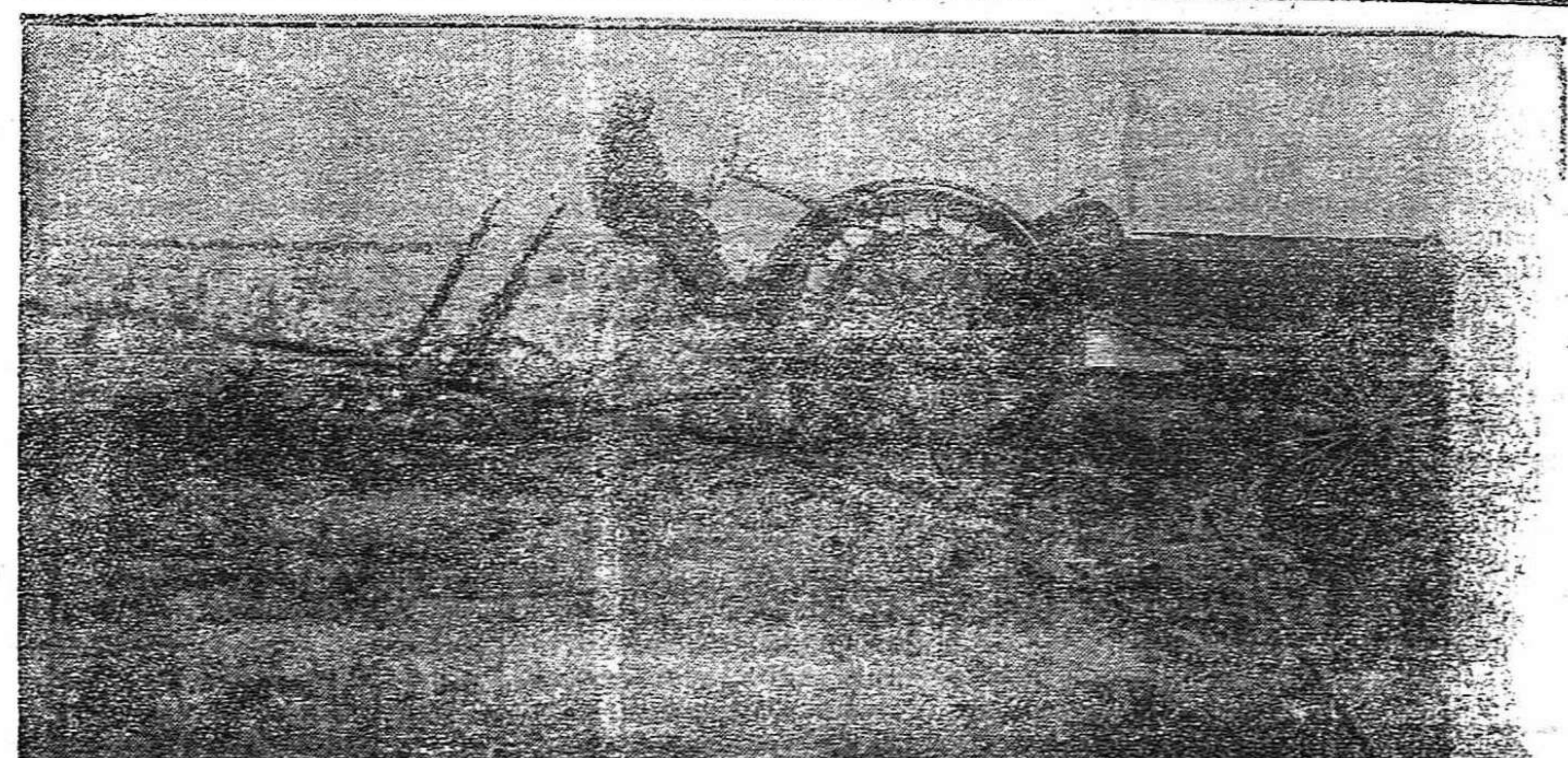
DE LA GUERRA.—Labrando el campo contractor.

Para optar a la subasta de construcción de la carretera de Camarzana de Tera a La Bañeza, han pre-