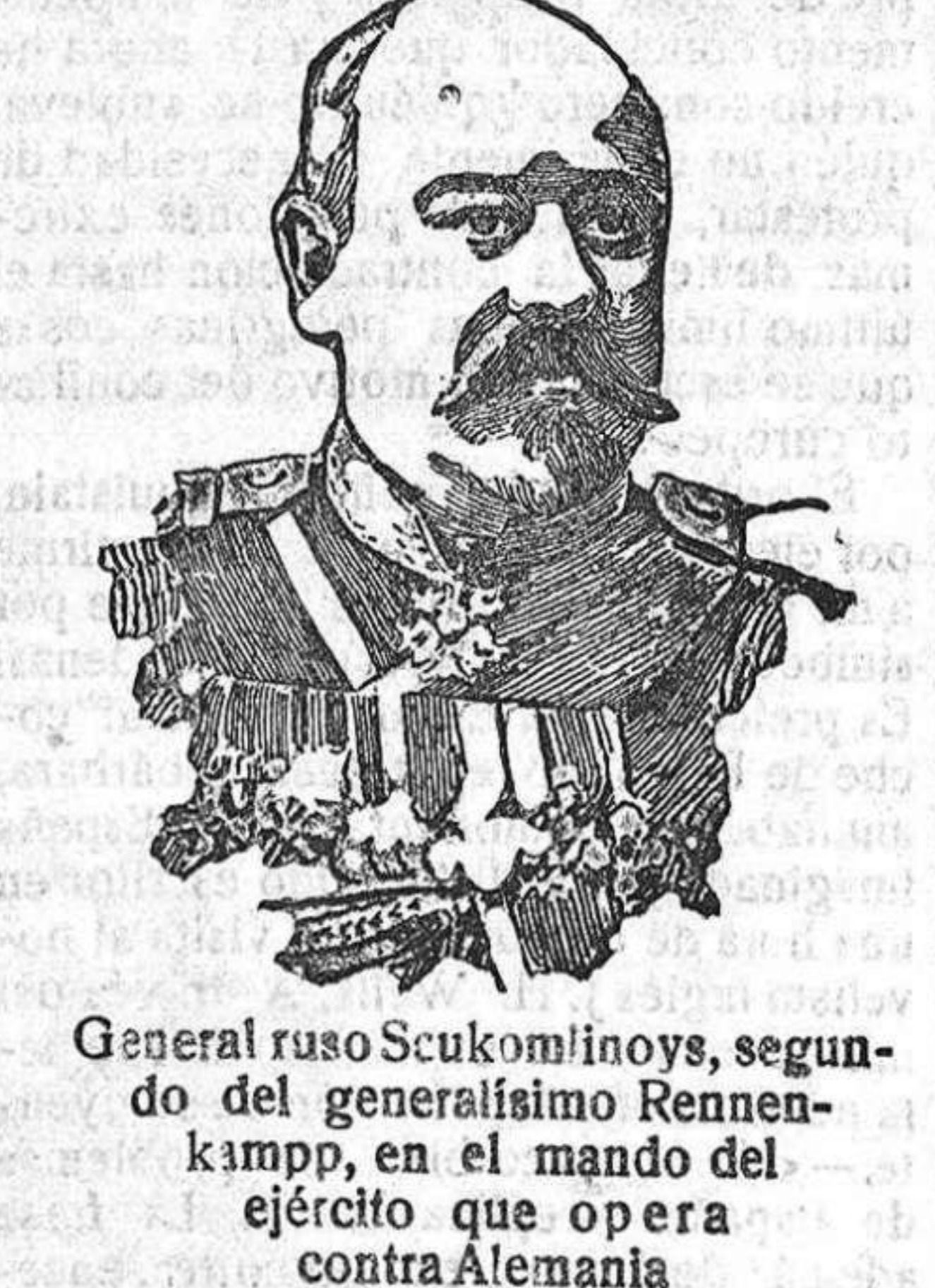
General ruso Scukomlinovs, segundo del generalísimo Rennenkampff, en el mando del ejército que opera contra Alemania.