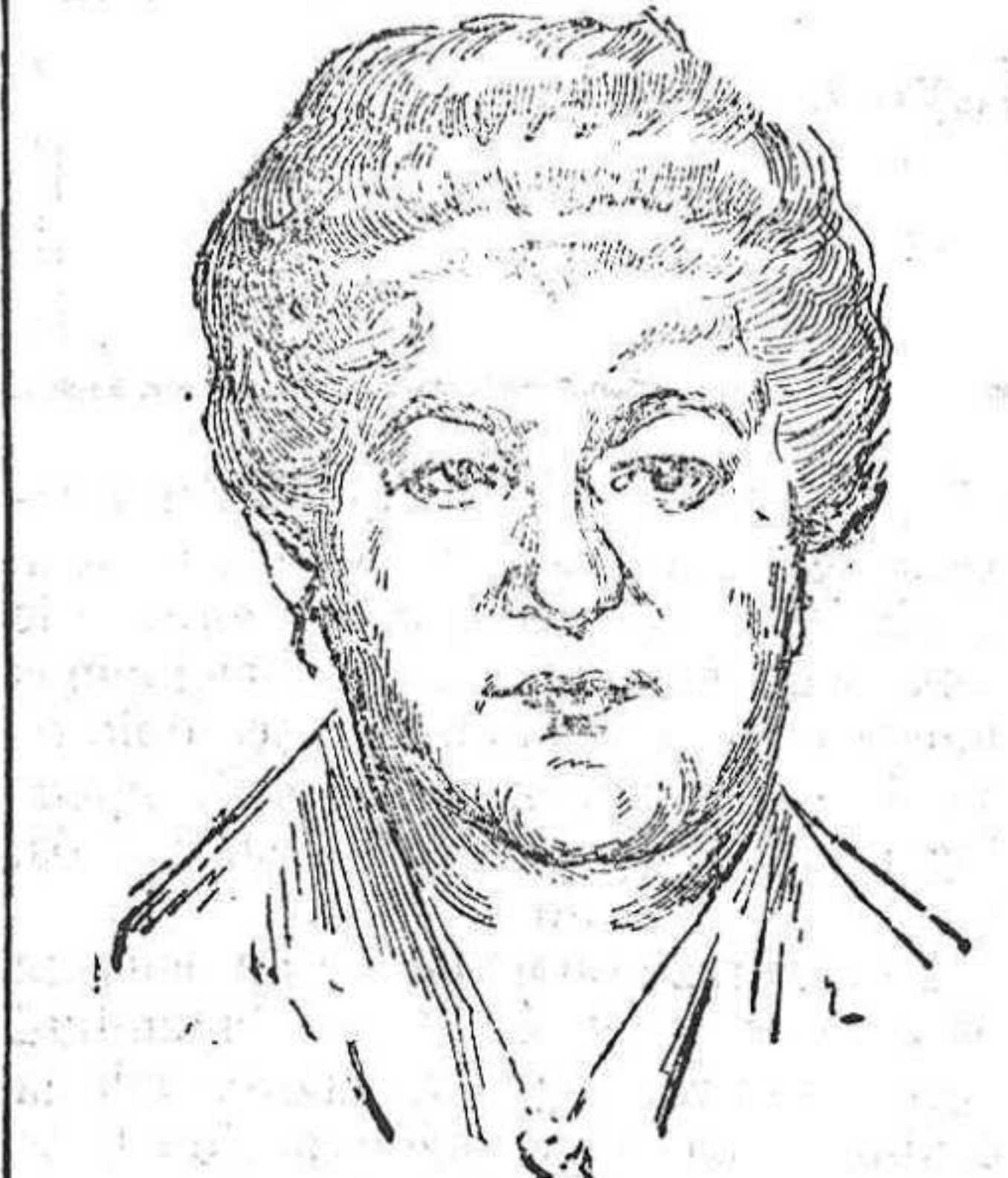
DOÑA EMILIA PARDO BAZAN