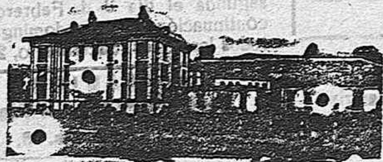
Sanatorio Quirúrgico del Dr. Madrazo

El freno reseñado a las 4 ruedas del 519, es el único perfecto hasta la fecha y no puede confundirse con el que anuncian otras marcas incluso en coches pequeños y baratos, que únicamente son un constante y eminente peligro para los conductores y viajeros por su imperfección y falta de seguridad dada su baratura.