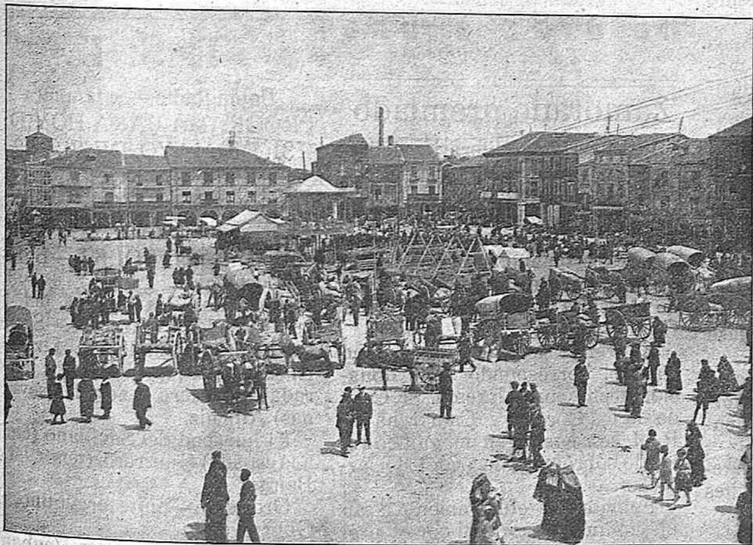
Plaza de la Constitución de Medina, en la que se celebró el mitin.

Próximo al histórico Castillo de la Mota el jefe del Gobierno procedió a la inauguración de las