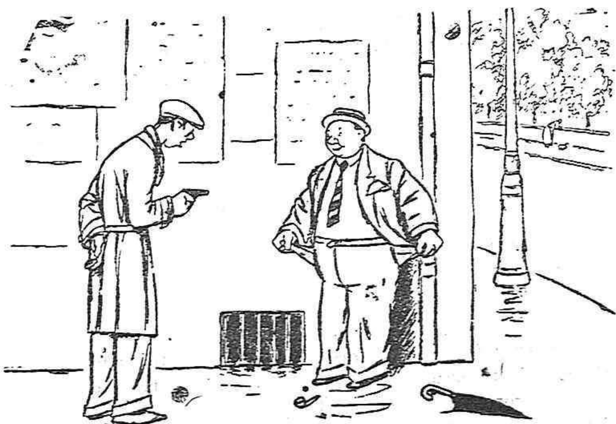
El atracador al irse. —¿De modo que después de estar aquí dos horas largas resulta que está usted «limpio»? Usted es un sirvergüenza. ¡Así no salí a la calle ninguna persona decente, señor!

El asunto se examinará de nuevo en otro Consejo."