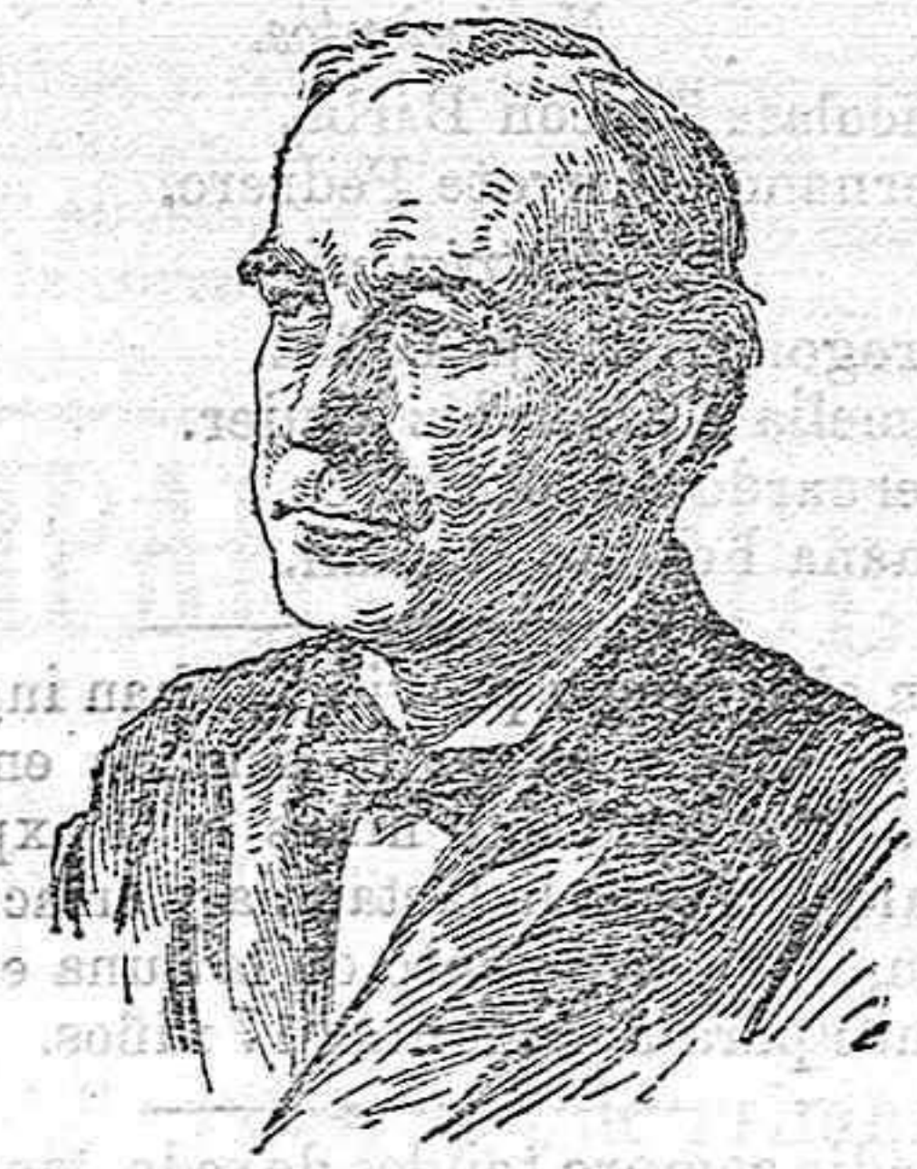
MISTER BRYAN Candidato derrotado en las elecciones verificadas en los Estados Unidos para Presidente de la República.