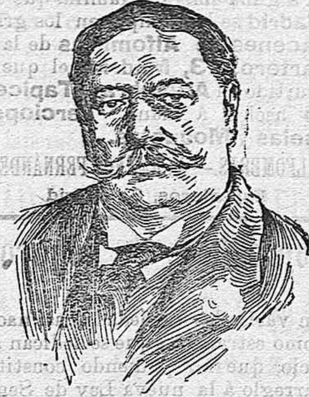
MISTER TAFT Nuevo presidente de los Estados de la América del Norte.

Pues, sin embargo, es una de las que menos se preocupa el Estado por servir y fomentar su riqueza.