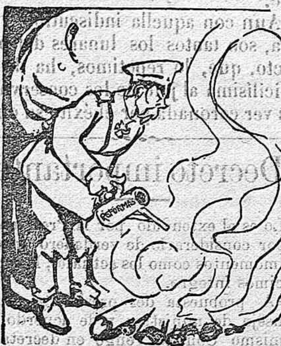
El Czar y los revolucionarios.

Querido director: Los elementos radicales de esta localidad preparan la celebración de un mitin en el que tomarán parte varios republicanos de esa y de otros pueblos de la provincia.