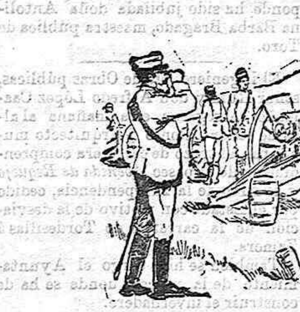
El general Marina observando los efectos de los disparos de una batería.