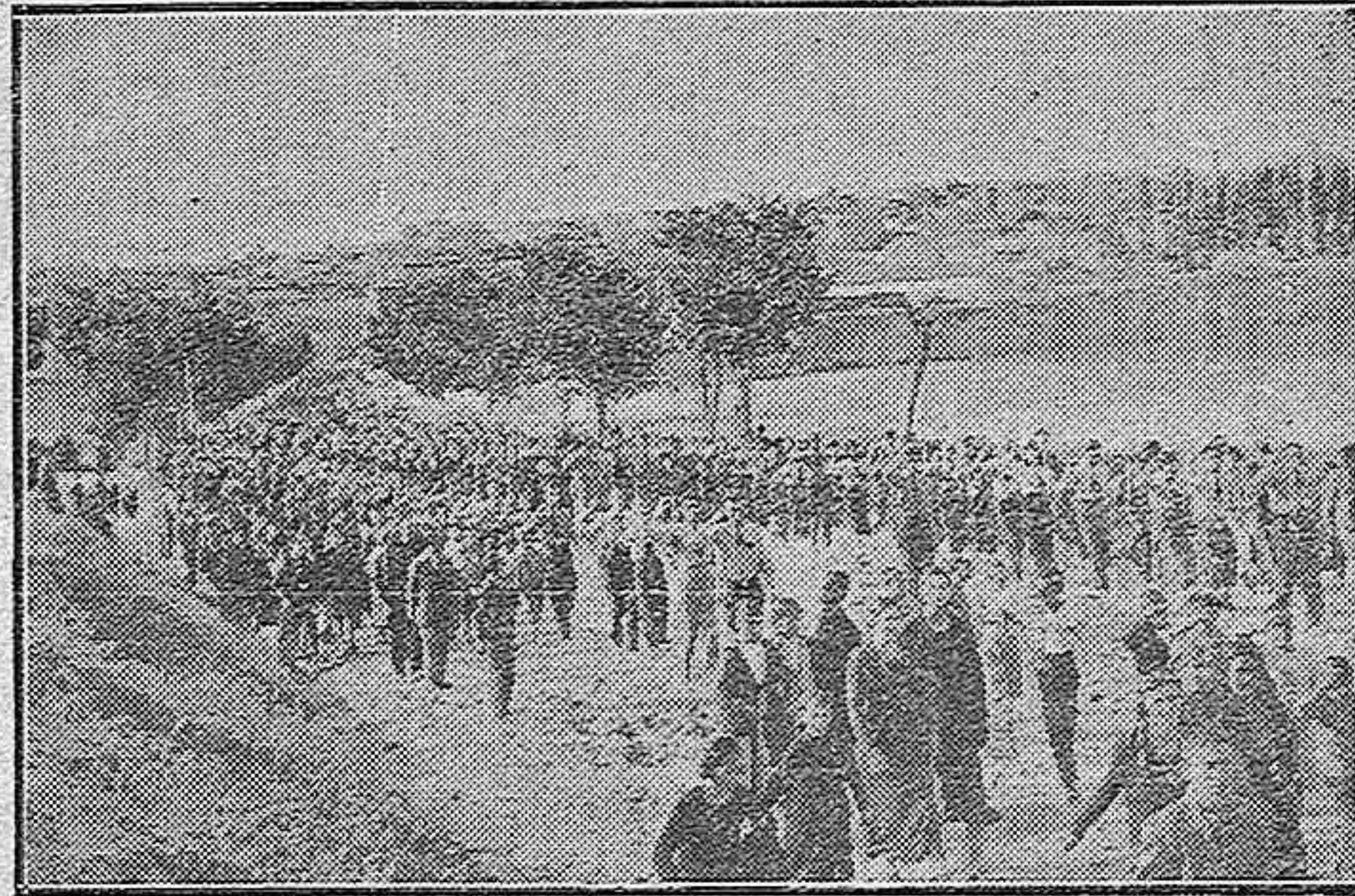
Una perspectiva de la enorme masa que acompañó los restos de nuestro infortunado compañero.

Se lo decimos con toda la autoridad que nos dan nuestras canas, don Antonio, muchos chicos de la Facultad de Derecho van terminando sus carreras con el sentimiento de no conocer al hombre célebre del Estatuto. Dicen entre ellos que si le han elevado el sueldo de la Cátedra a veinte mil leandras, ya tendrán derecho a verle alguna vez por el aula para apreciar su estudiada actitud fotogénica. Dicen también que la clase está en malas manos, que el tal García que la rige se goza tanto en suspender con esa chulería, de que usted tantas veces habla, que ya se van