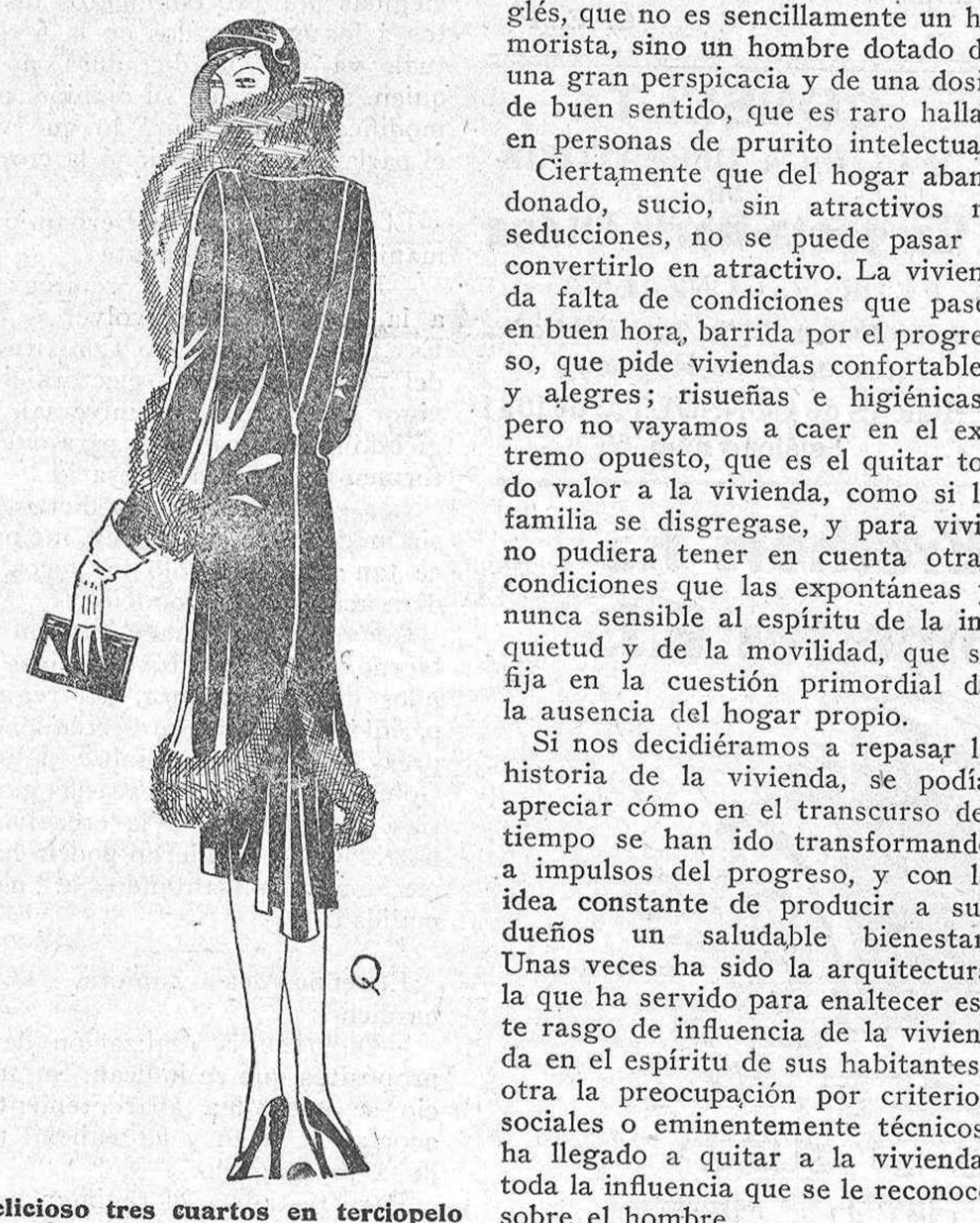
Delicioso tres cuartos en terciopelo inglés negro adornado con renard

Dos mágicas palabras, tienen la culpa; libertad y juventud. Ellas son ahora en la moda la verdadera fuerza, la sólida idea filosófica