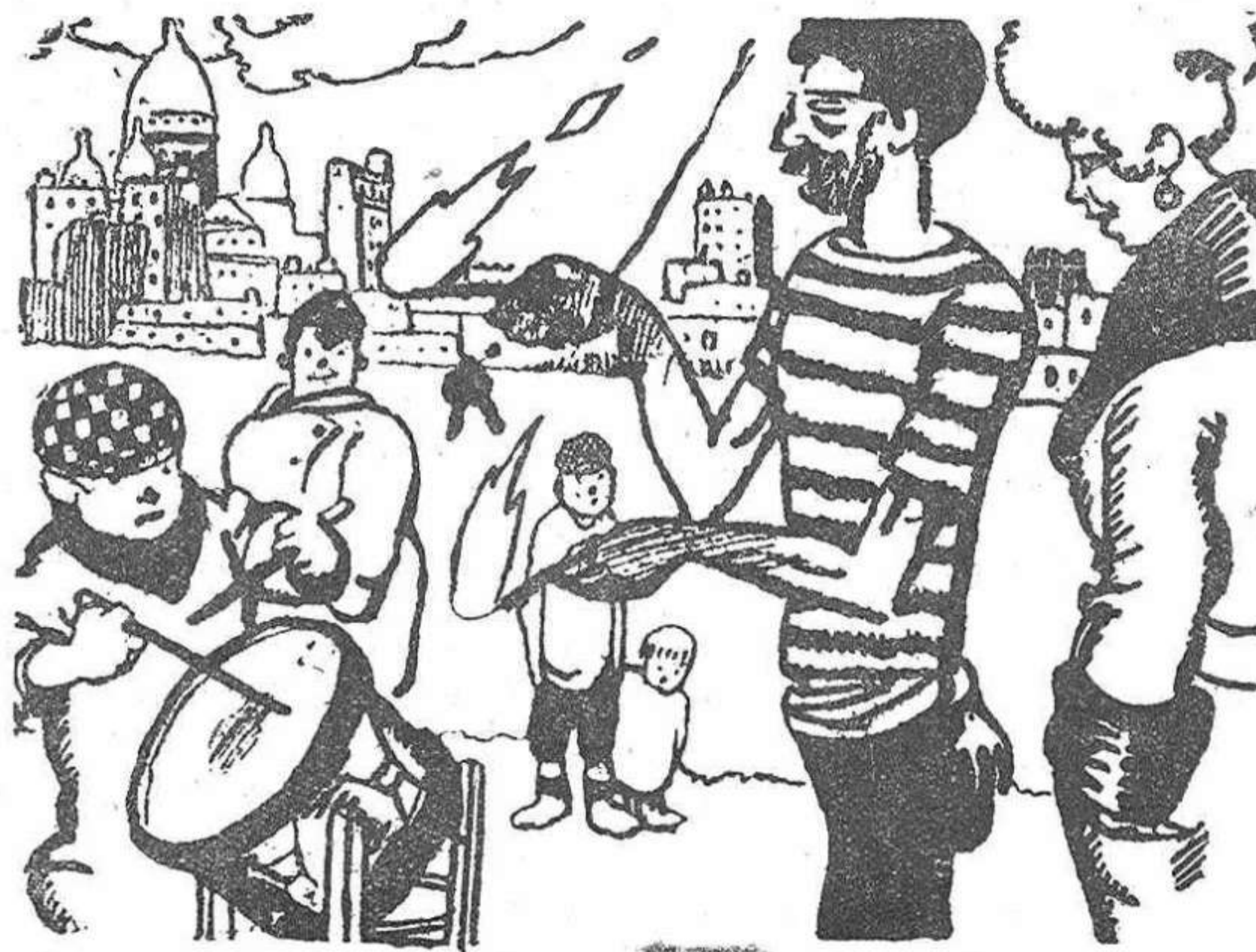
EL QUE SE TRAGABA LAS LLAMAS

MEDICO-TOCOLOGO ENFERMEDADES DE LA MUJE TRATAMIENTO CON DIATERMIA CONSULTA: de 11 a 1 y de 4 a 6 Ramón Alvarez, 3, pral.—Zamora Teléfono 214