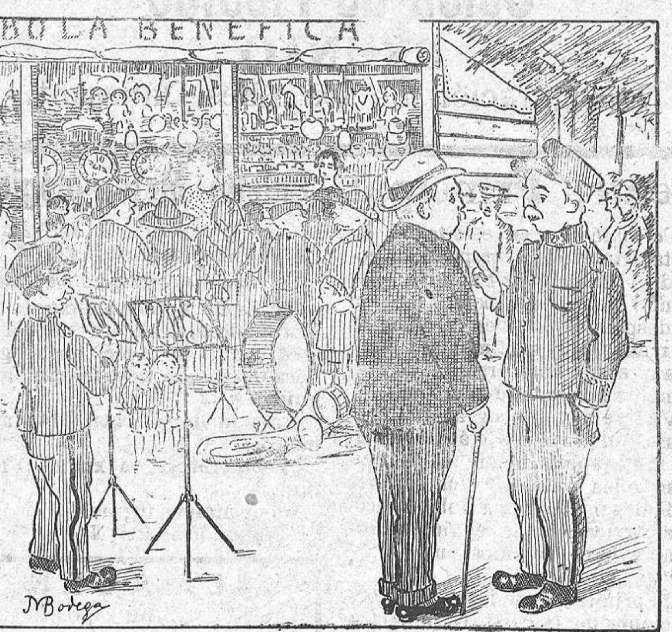
Por J. M. de la Bodega EL CABALLERO.—Su jongo que durante la rifa tocará la música. EL DIRECTOR.—De ninguna manera, la música no entra en el sorteo.