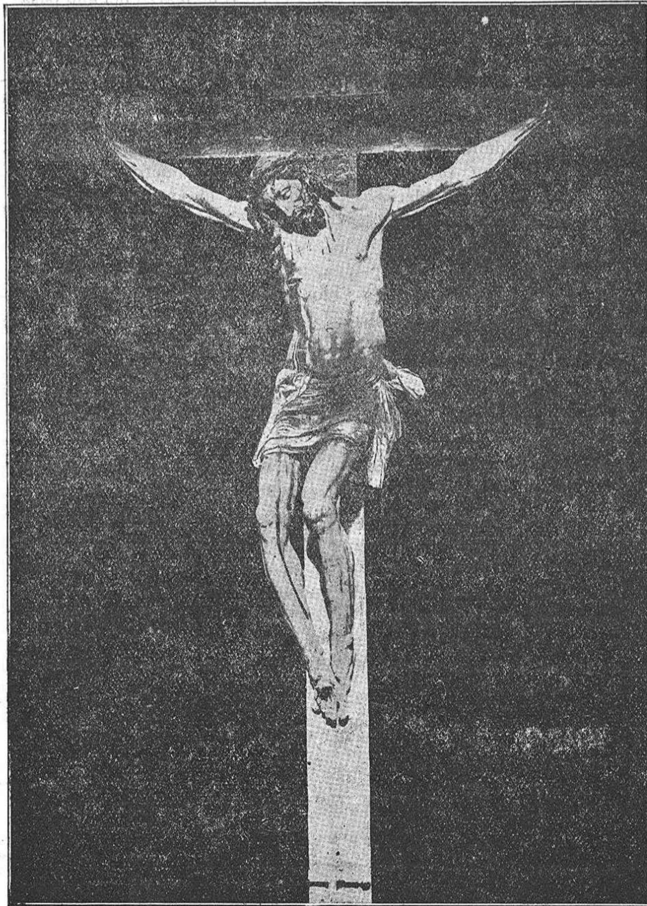
Santísimo Cristo de las Injurias. (Obra de Gaspar Becerra) las personas directoras de esta cofradía, su procesión es una de las más suntuosas de nuestra Semana Santa, donde la religiosidad corre pareja con la compostura de sus cofrades y el fervor del pueblo, ante la imagen del Crucificado, en el momento de su muerte. Esta majestuosa imagen, que el día de Viernes Santo, figura en la procesión de la Real Cofradía del

Sale de la Catedral, a las ocho de la noche, después que los cofrades, hacen ante la efigie promesa de devoción y silencio, y organizada la procesión, ésta se dirige por las calles de Rúa de los Notarios, Sagasta. San Torcuato Palomar Chico a la iglesia de San Esteban, donde es