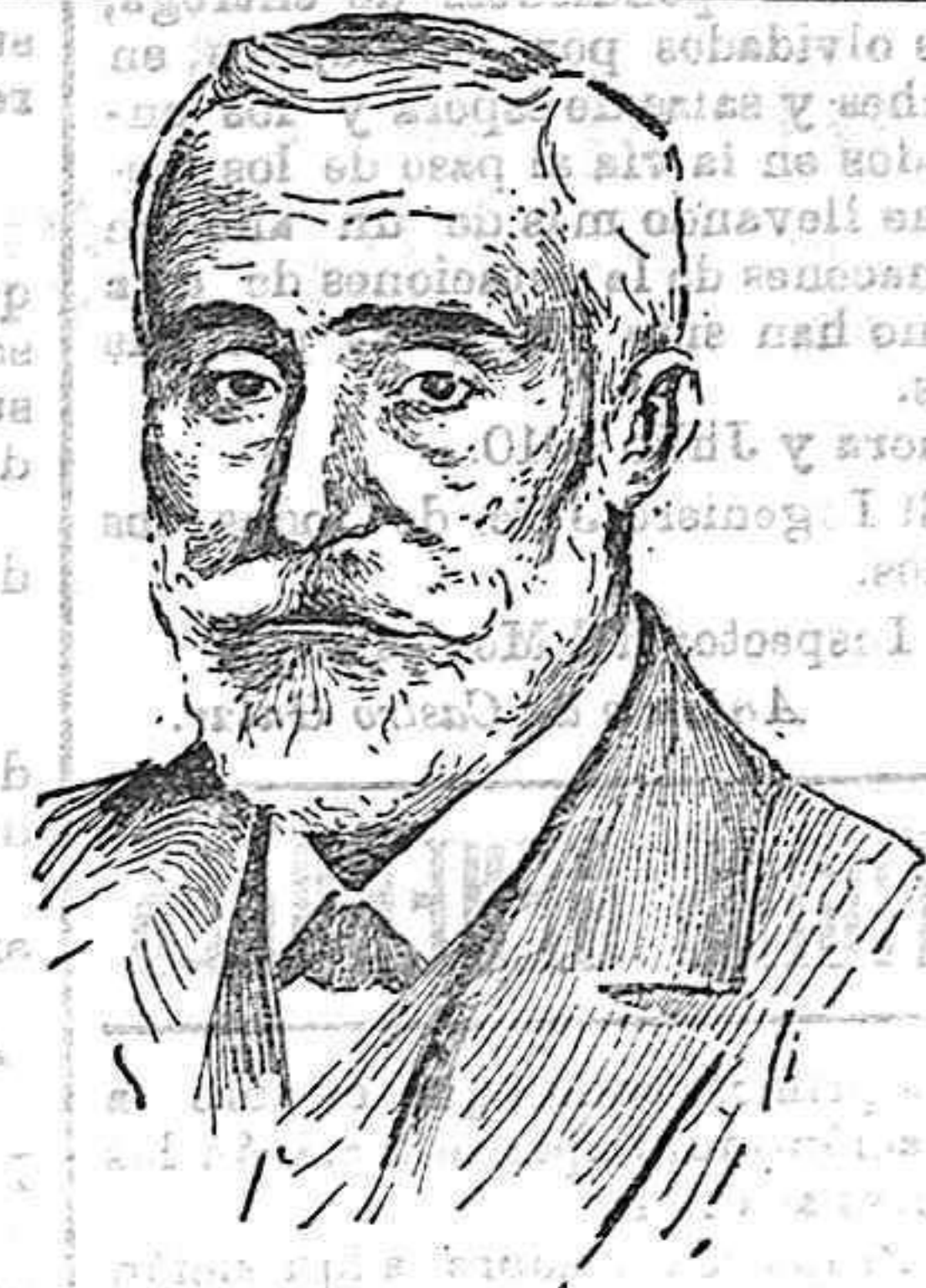
Don Antonio Maura.

Es de suponer, en suma, que la cosecha de vino se reduzca lo menos en una mitad.