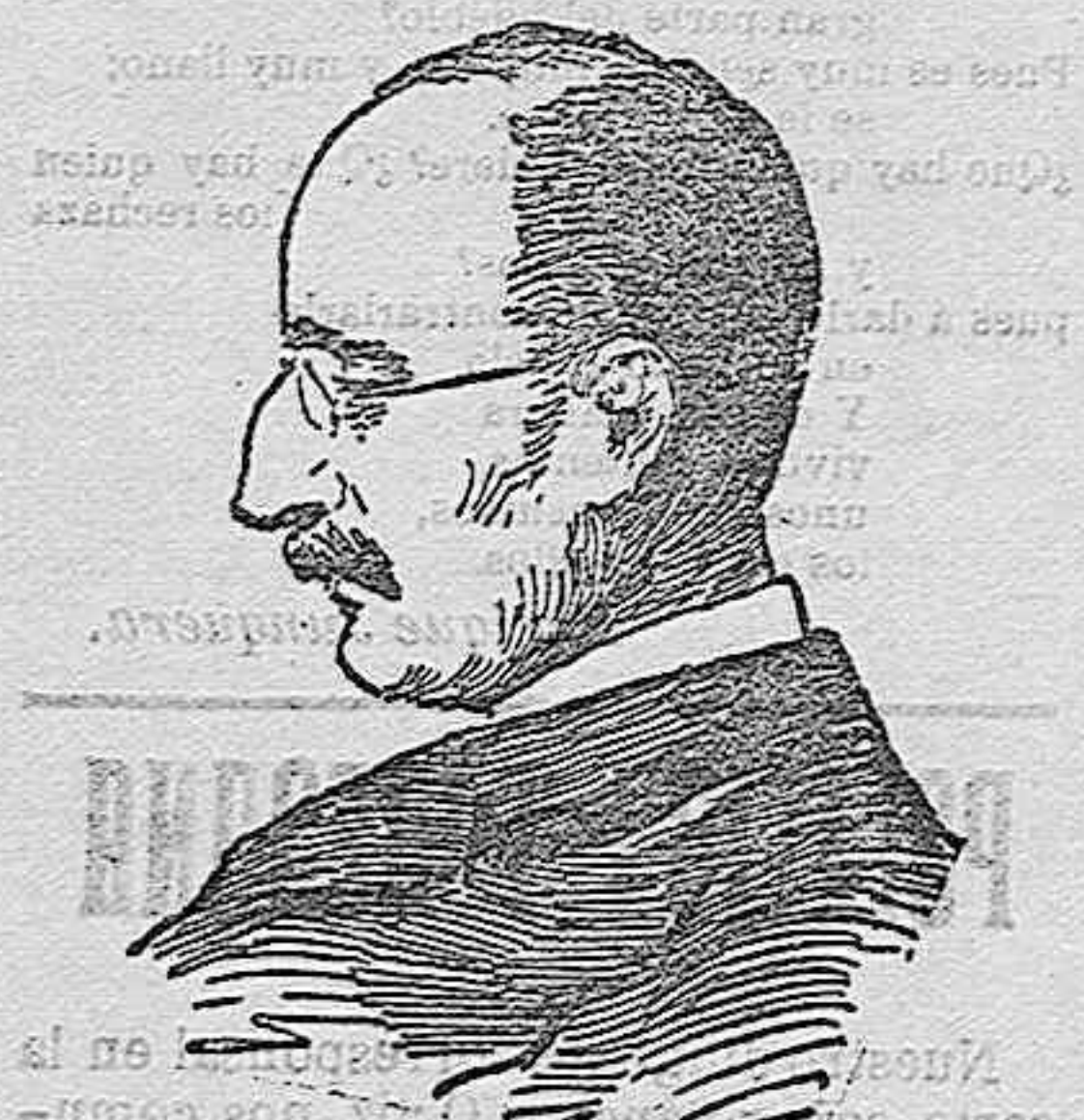
DR. MAX PLANK agraciado con el premio Nobel.

El señor Rodríguez Vega hizo un mal negocio, que le ha costado 6.000 duros y acaso 2.000 duros más, pues de presumir es que el cheque de las 10.000 pesetas, fuera un cheque enfermo que pasó un vivo.