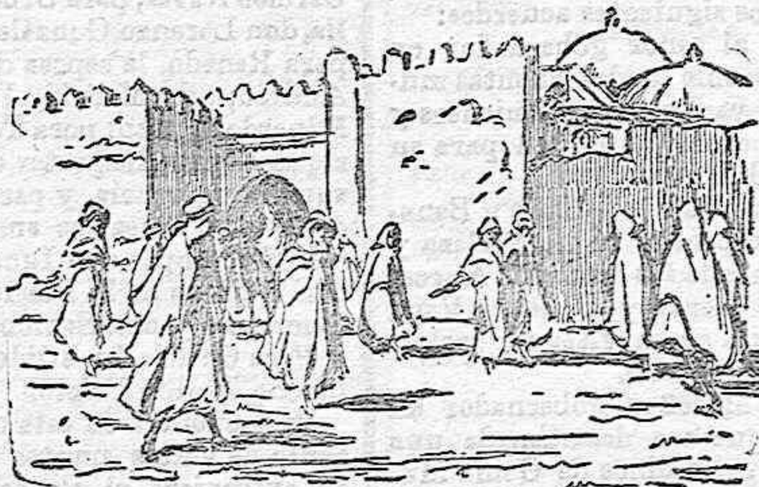
UN BINCON DE ALCAZALQUIVIR

A la salida. El señor Canalejas, á la salida, manifestó que había pronunciado un discurso ocupándose de asuntos internacionales y dando cuenta del desarrollo de las negociaciones para la solución de los incidentes surgidos, siendo todas las impresiones muy satisfactorias. Se ocupó después de medidas sanitarias, acordándose que en breve se reúna el Consejo de Estado para tratar del crédito extraordinario destinado al servicio de Sanidad para prevenir contra la importancia del cólera. El jefe del Gobierno manifestó que no había motivo de alarmas en España, porque el estado sanitario es excelente. Dió cuenta también el jefe del Gobierno de la visita del alcalde y de un concejal de Zaragoza, quienes solicitaron del Gobierno remedio á la crisis por que atraviesa aquella capital. El señor Canalejas estimuló á los ministros para que estudien qué clase de construcciones civiles pueden emprenderse, sin perjuicio de los caminos vecinales que hayan de construirse en cuanto haya créditos. El Corresponsal. Madrid 26 de Julio de 1911.