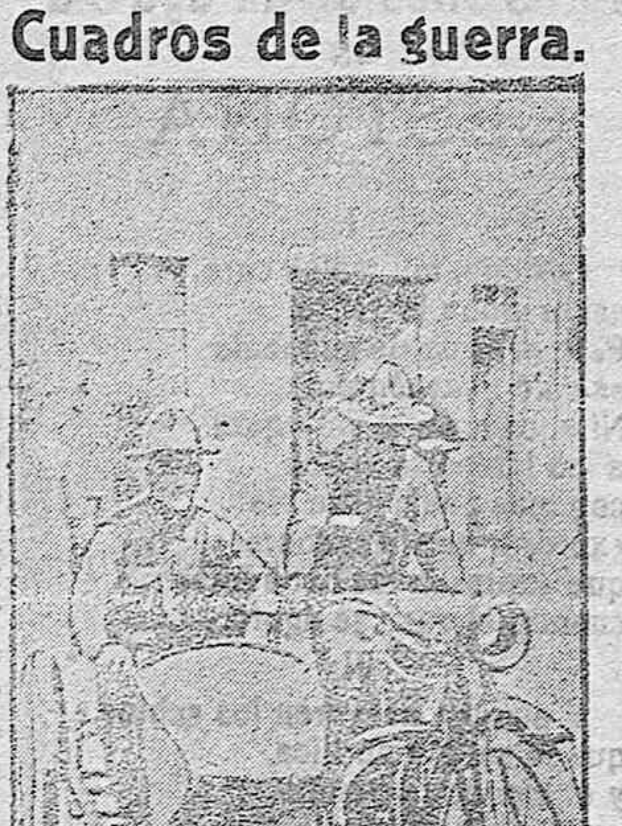
Motociclista americano.

Como continúa la favorable disposición de los compradores, siguen colocándose con relativa facilidad cuantas ofertas se presentan, a pesar de los elevados precios con que se plantean...