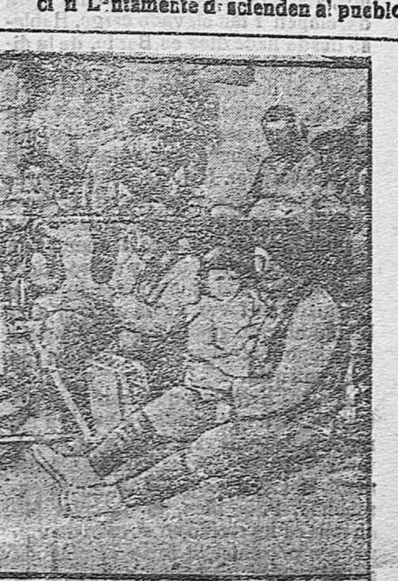
APUNTES DE LA GUERRA.—Ametralladoras francesas en Grecia.

Una campana envía al aire sus tañidos, anunciando la hora de la oración. Lentamente descendien al pueblo