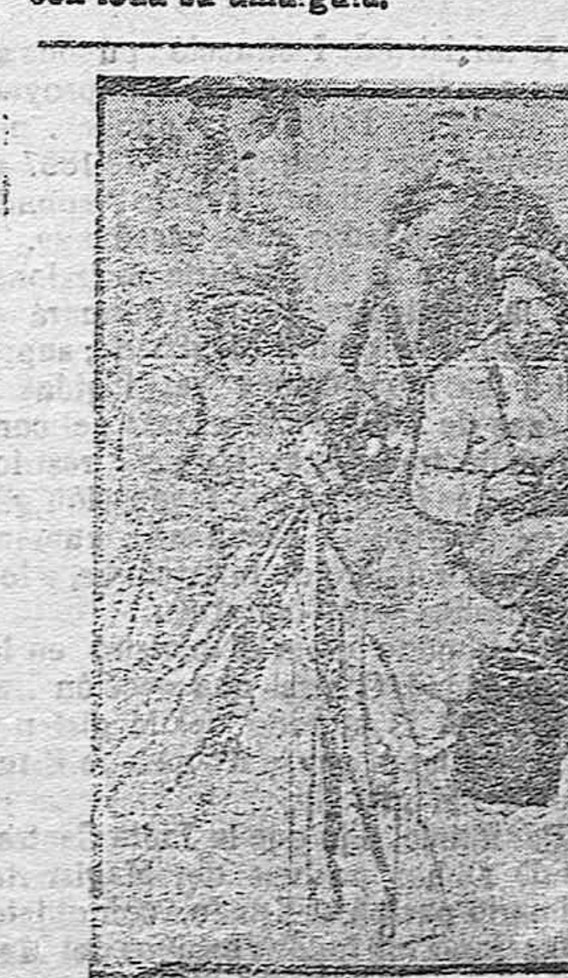
APUNTES DE LA GUERRA.—Ametralladoras francesas en Grecia.

Una campana envía al aire sus tañidos, anunciando la hora de la oración. Lentamente descendien al pueblo