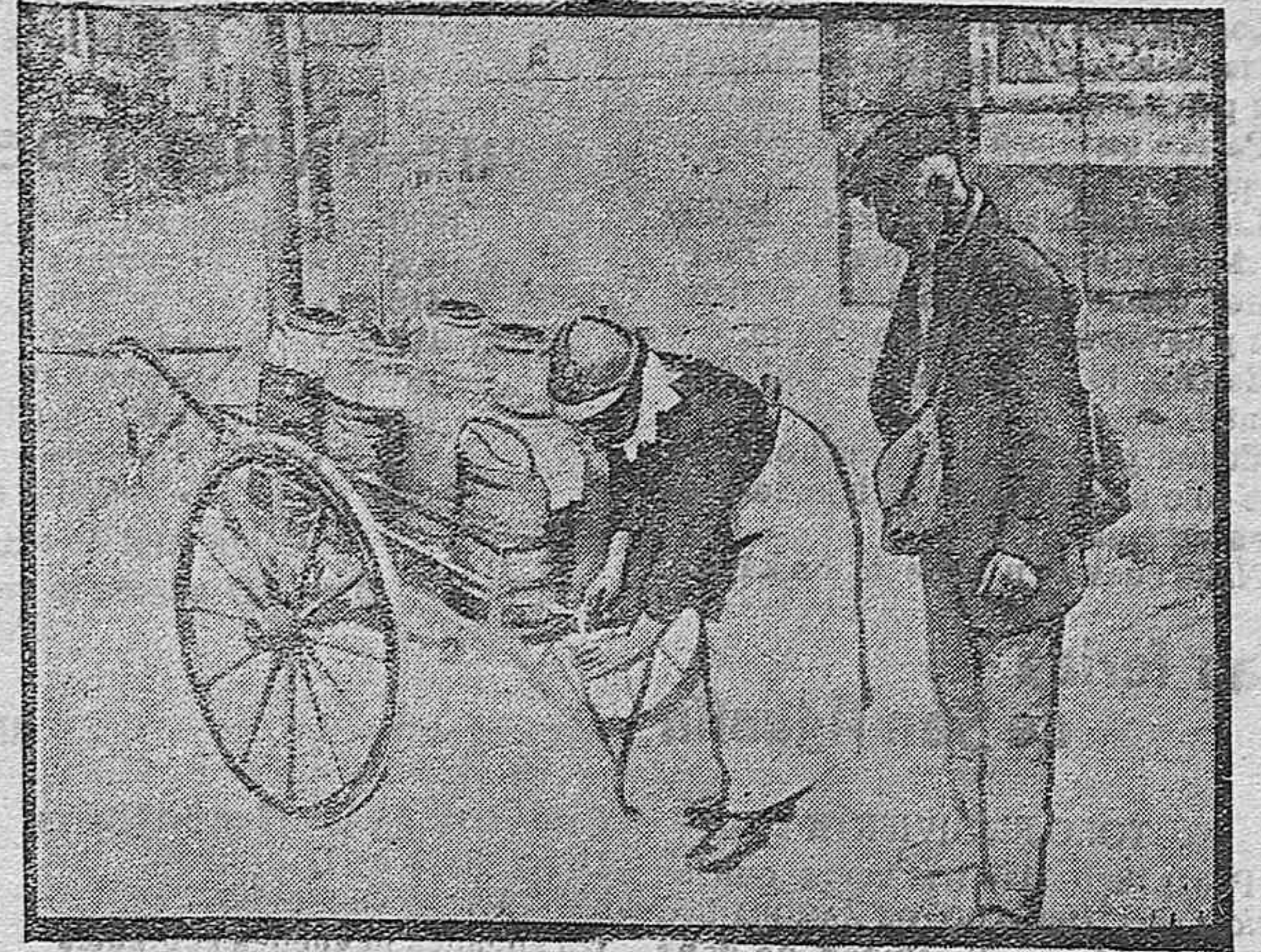
ESCENAS DE LA GUERRA.—Vendedor de leche en Rims.

En Lens, se lucha dentro del casco de la ciudad. Esta seguramente quedará destruida por completo.