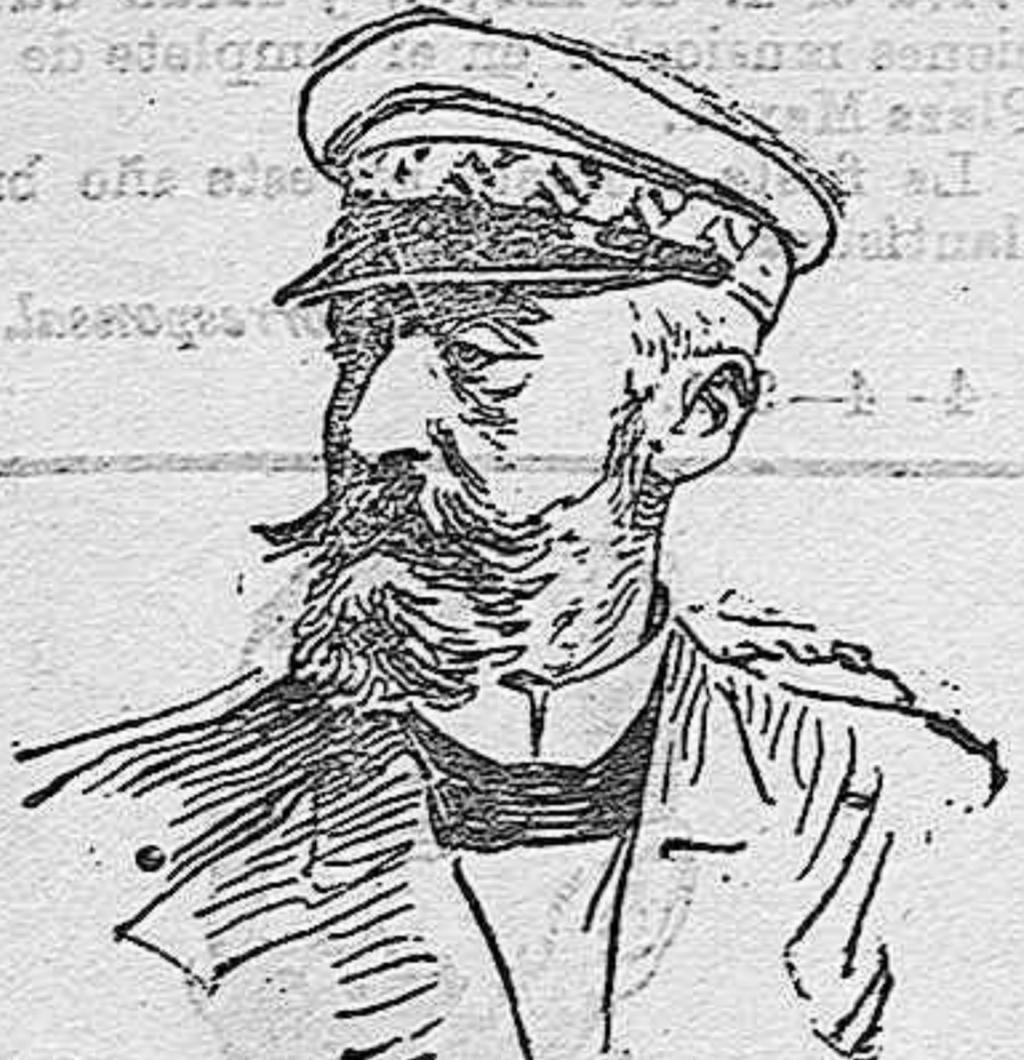
GENERAL LUQUE, nuevo ministro de la Guerra.

En la India han estado lluvias muy beneficiosas, en la parte septentrional. Las perspectivas son favorables, pero en las Erovicias Unidas se quejan de daños por las lluvias y el granizo. De Rusia dicen que se espera la reapertura del Azoff dentro de unos quince días. En el Sur, los frios recientes han producido algunos daños en las cosechas. Los arribos son generalmente flojos.