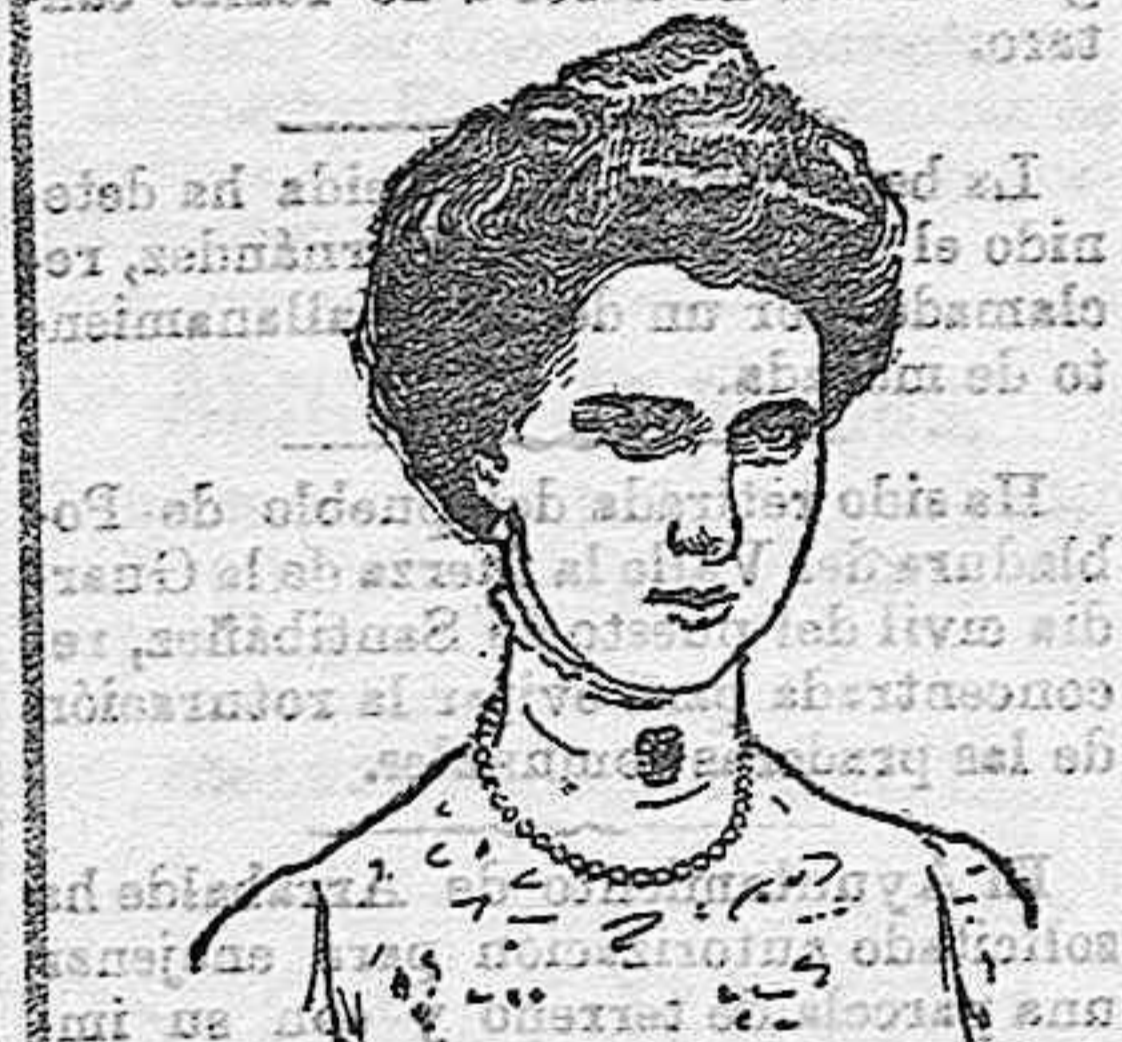
La princesa Beatriz de Sajonia-Coburgo.

Don Alfonso de Orleans. Esta fué una de las consecuencias inmediatas de un iudicio que se veía contrariado por motivos religiosos. La princesa Beatriz de Sajonia-Coburgo, resistiese á adajar el protestantismo, requisito indispensable para ser consentido su matrimonio con un infante de España, y don Alfonso de Orleans, cogido entre el cariño de la bella á quien había entregado su corazón y el respeto y la obediencia debida á los suyos, y sobre todo al Monarca que además de ser jefe de su familia era la más elevada autoridad del Ejército á que él pertenecía como oficial; no acertaba á solucionar tan grave conflicto.