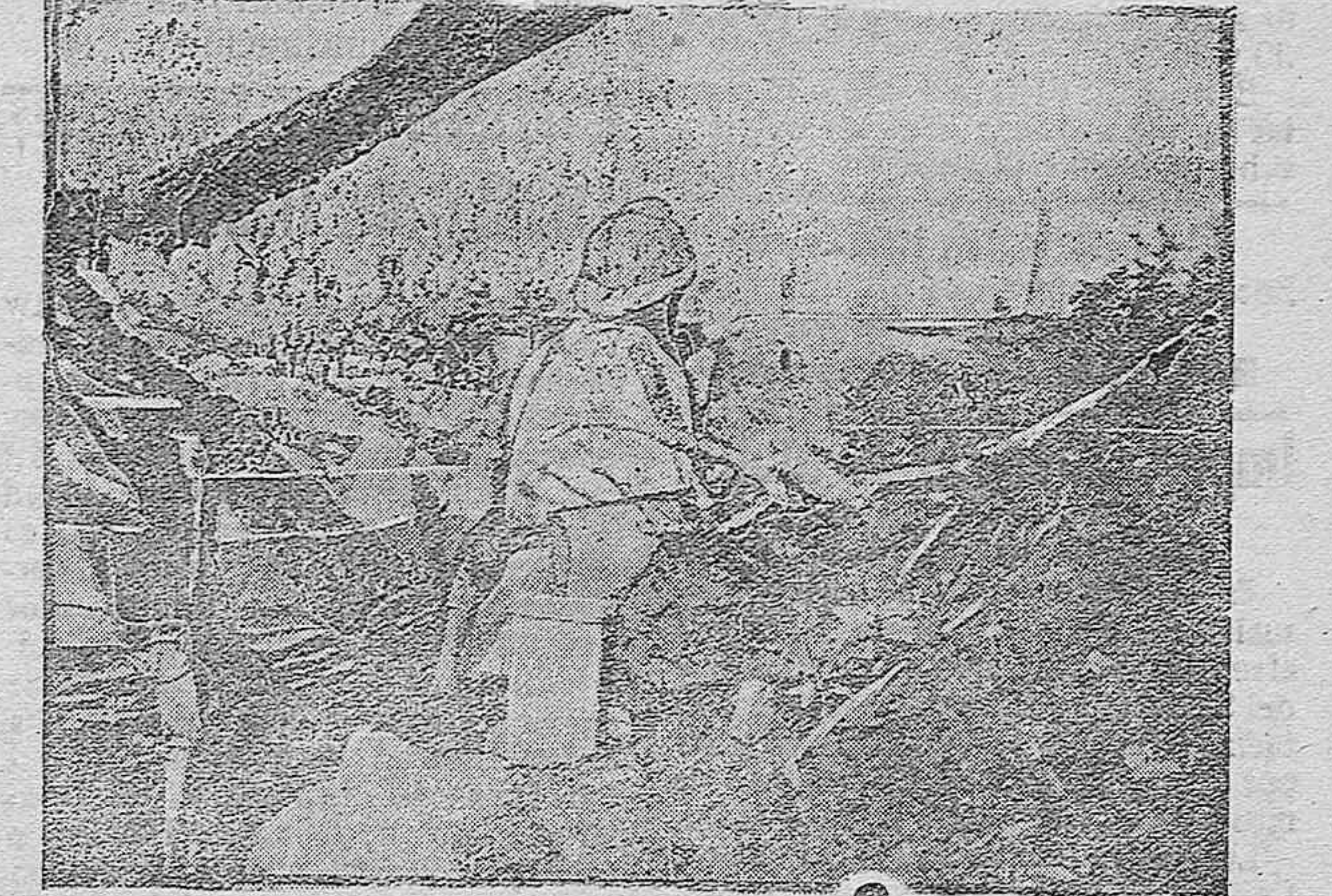
Trinchera alemana cogida por los franceses.

Esta emigración de hace ya muchos años no ha rebajado en nada el censo de la población española. Efectivamente, el último censo perfeccionado arroja una población de cerca de 21 millones de habitantes que en relación con los años anteriores, vemos un determinado aumento.