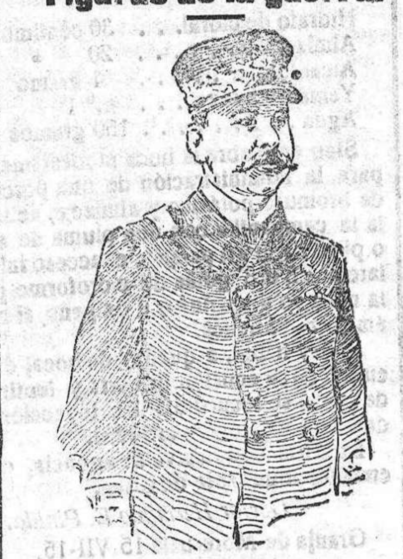
Almirante Leonardo Cattolica ex ministro de Marina de Italia.