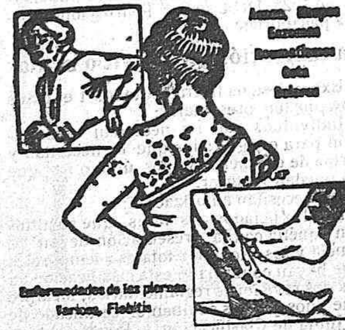
Enfermedades de las piernas: Varices, Fiebril.