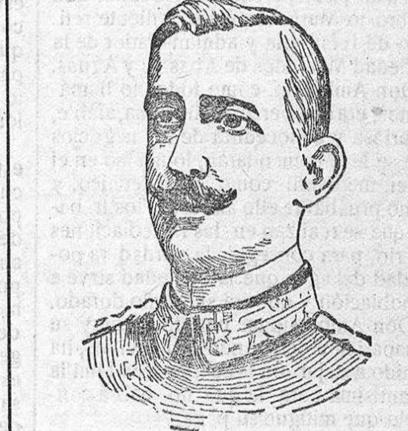
El duque de Aosta, comandante del ejército italiano que se ha apoderado de la plaza fortificada de Gorizia.