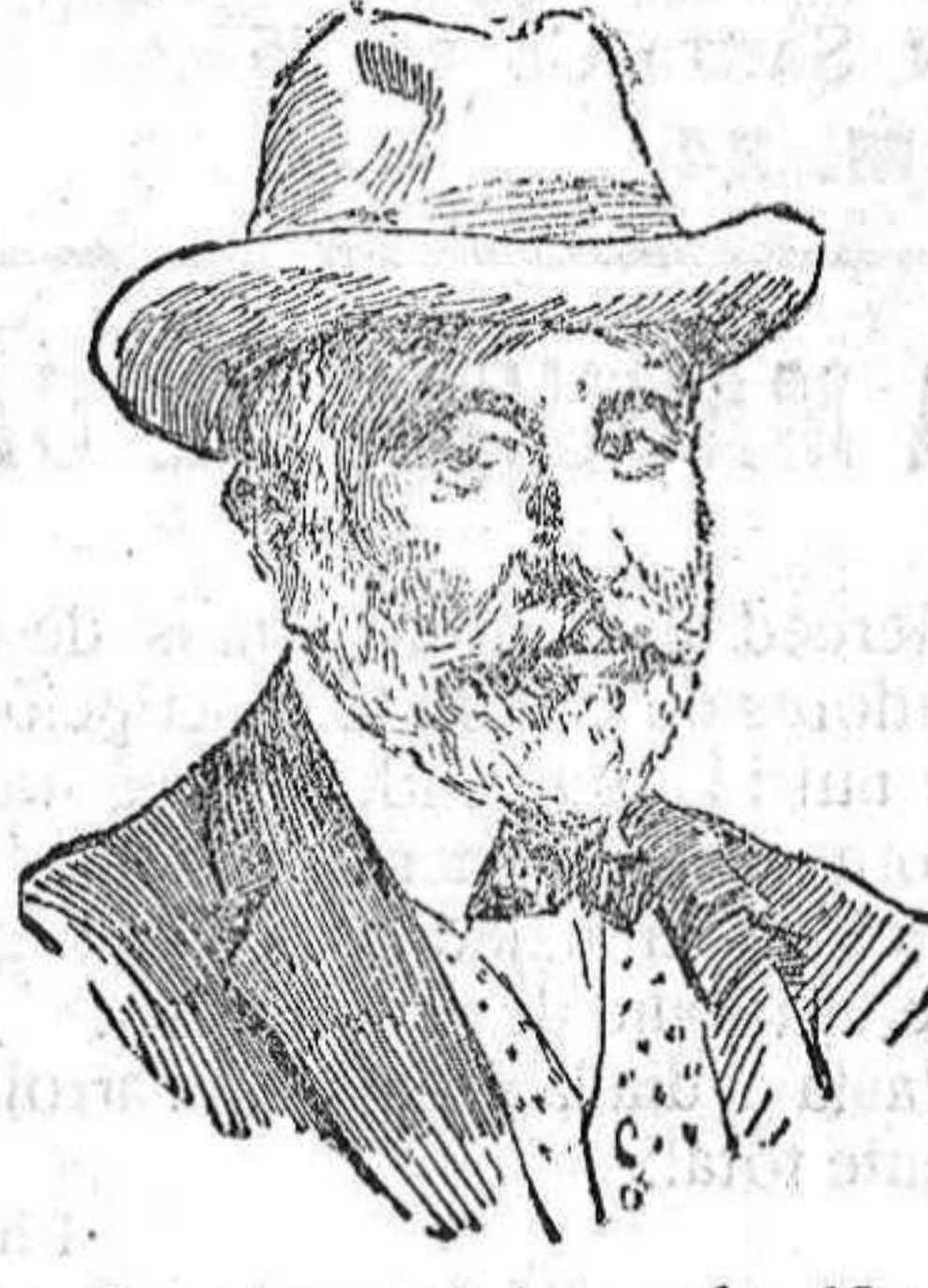
Señor Sonnino ministro de Negocios Extranjeros.