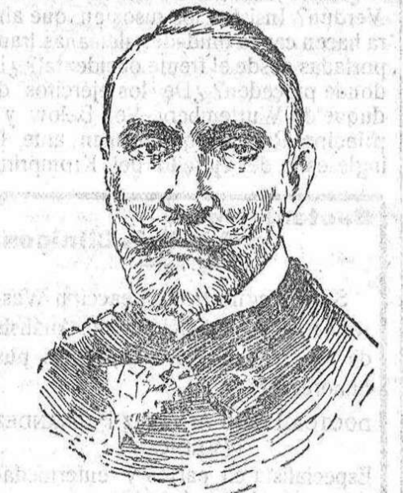
Almirante Camillo Corci nuevo ministro de Marina de Italia.