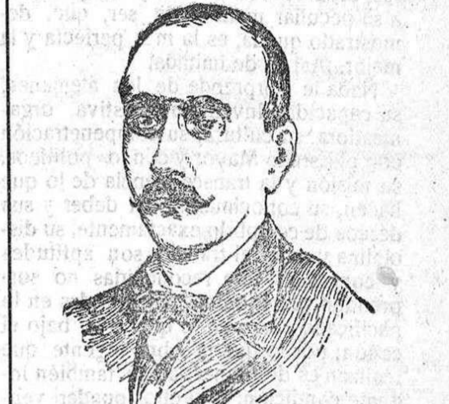
Señor Bissolati comisario para los efectos de guerra.